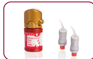
EQUIA Forte™ HT Cost-effective, long-term restorative alternative