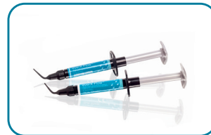
everX Flow™ Fibre-reinforced flowable composite for dentine replacement

Verlieben Sie sich in Ihr nächstes Restaurationsmaterial von GC