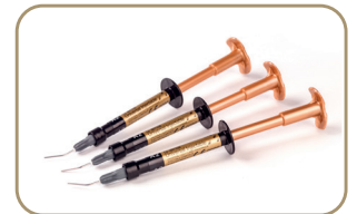
G-aenial® Universal Injectable High-strength restorative composite