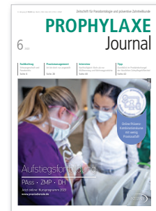
Titelbild: White Cross

Im Namen des gesamten Teams unseres Prophylaxe Journal möchten wir uns bei Ihnen, liebe Leser, Autoren und Industriepartner, herzlich bedanken – für Ihr großes Interesse und die engagierte Zusammenarbeit in diesem Jahr. Wir wünschen Ihnen ein frohes Weihnachtsfest und einen erholsamen Jahreswechsel. Starten Sie in 2023 gesund und erfolgreich!