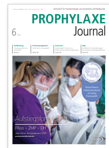
Titelbild: White Cross

Im Namen des gesamten Teams unseres Prophylaxe Journal möchten wir uns bei Ihnen, liebe Leser, Autoren und Industriepartner, herzlich bedanken – für Ihr großes Interesse und die engagierte Zusammenarbeit in diesem Jahr. Wir wünschen Ihnen ein frohes Weihnachtsfest und einen erholsamen Jahreswechsel. Starten Sie in 2023 gesund und erfolgreich!