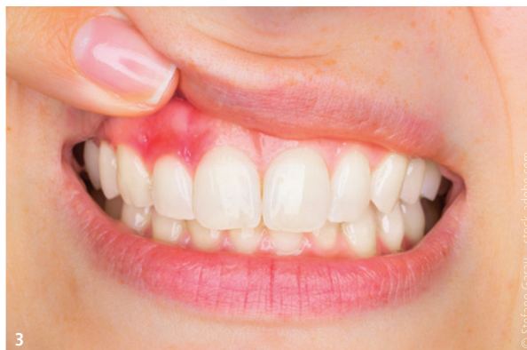
Abb. 2 und 3: Eine geschwollene oder gerötete Gingiva ist während der Schwangerschaft oft der Fall. Es kann zu einer sog. Schwangerschaftsgingivitis kommen.

der eigenen Mundhygiene steigern. Welche Auswirkungen aber hat die Schwangerschaft auf das Parodont, beziehungsweise haben Gingivitis und Parodontitis einen negativen Einfluss auf die schwangere Frau und die Entwicklung des ungeborenen Kindes? Seit fast 50 Jahren wird nunmehr zu diesem Thema geforscht.