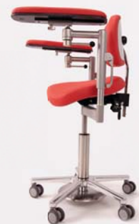
Mikrochirurgiestuhl BALANCE ADVANCE

Behandlungsliegen und Mikrochirurgiestühle von BRUMABA ermöglichen eine ideale Arbeitsposition und rückschonendes Behandeln am Mikroskop für Arzt und Assistenz. Die Arbeitssicherheit wird dabei durch einen kopfnahen, integrierten Mikrochirurgiering sowie individuell einstellbare Unterarmstützen erhöht. Viskoelastische Polster und flexible Liegepositionen sorgen für eine professionelle und komfortable Patientenlagerung bis 300 kg.