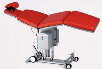
Multifunktionaler Operationstisch PRIMUS