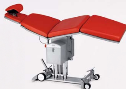
Multifunktionaler Operationstisch PRIMUS