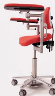
Mikrochirurgiestuhl BALANCE ADVANCE

Behandlungsliegen und Mikrochirurgiestühle von BRUMABA ermöglichen eine ideale Arbeitsposition und rückschonendes Behandeln am Mikroskop für Arzt und Assistenz. Die Arbeitssicherheit wird dabei durch einen kopfnahen, integrierten Mikrochirurgiering sowie individuell einstellbare Unterarmstützen erhöht. Viskoelastische Polster und flexible Liegepositionen sorgen für eine professionelle und komfortable Patientenlagerung bis 300 kg.