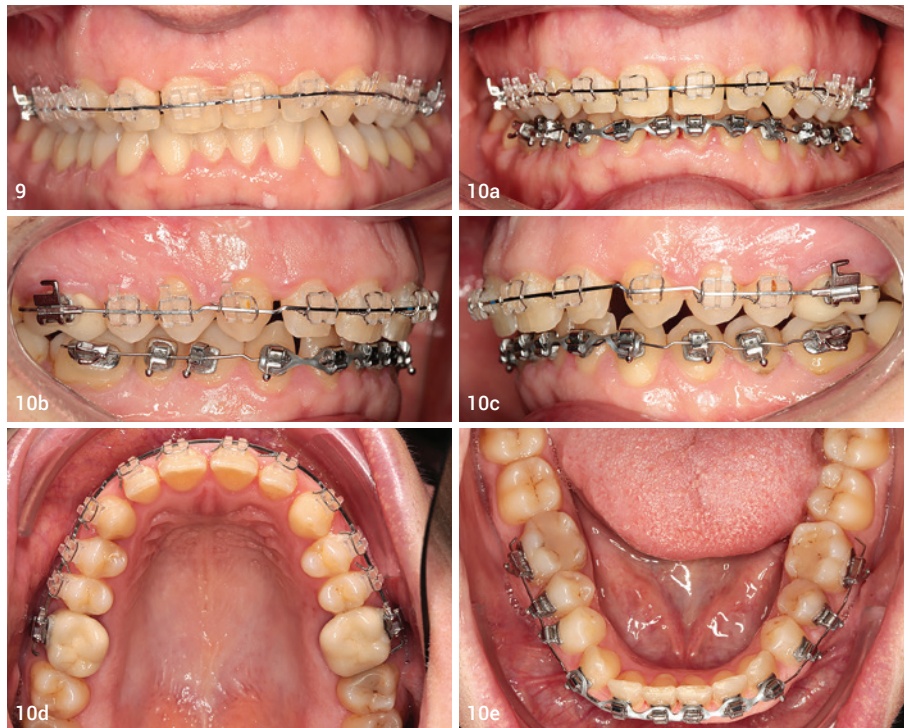
Abb. 9: Bissanhebung durch Aufrichtung und Anhebung der Oberkieferfront. Abb. 10a–e: Behandlungsfortschritt: Expandierter Oberkiefer, frontale Lückeneinstellung im Oberkiefer, Bissanhebung, Eingliederung der Unterkiefer-Multibracketapparat.

Sind die genauen Abstände der Zähne zueinander und zum Gegenkiefer erreicht, so gilt es, die Zähne bis zur endgültigen prothetischen Versorgung in ihrer Posi-