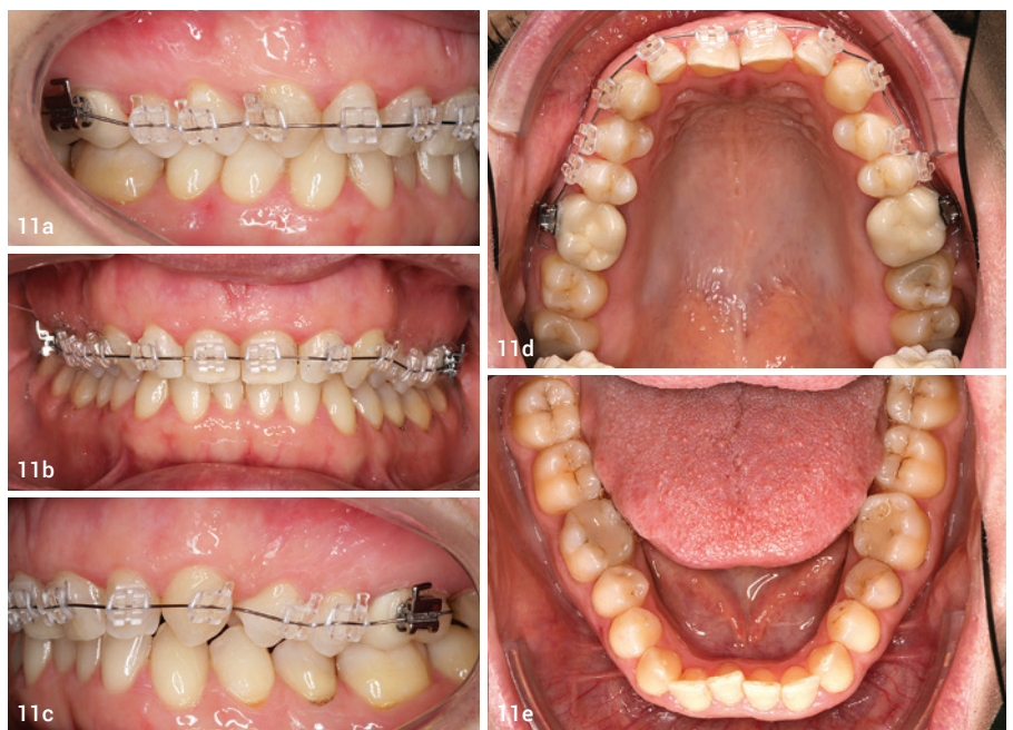
Abb. 11a–e: Zwischenbefund, gute Bissanhebung und Lückenöffnung in der Oberkieferfront für die geplante Kronenversorgung zur ästhetischen Zahnvergrößerung.

können entweder linguale Drahtretainer oder aufgeklebte Kunststoffshells die Front bis zur Präparation und Eingliederung der Prothetik fixieren.