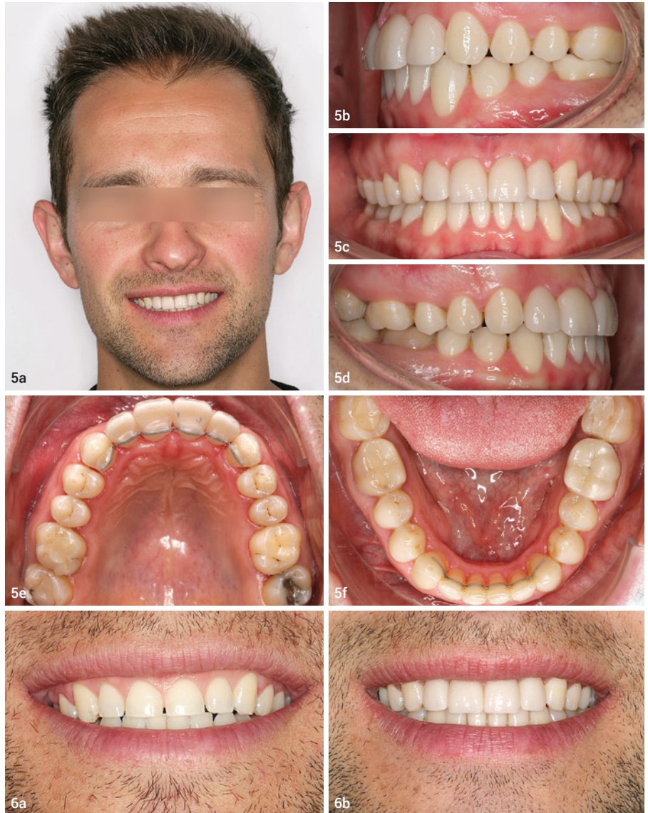
Abb. 5a–f: Ergebnis der kombiniert kieferorthopädisch-prothetischen Behandlung. Verlängerung und Verbreiterung der Zähne 12 bis 22 durch Vollkeramikronen. Langzeitretention durch linguale Kleberetainer. Abb. 6a und b: Vorher-Nachher-Frontansicht. Verbesserung der Lachlinie und jüngeres Aussehen durch eine größere Zahnexposition in der OK-Front.

Anhand der im Folgenden dargestellten klinischen Fallbeispiele (Fall 1: Abb. 4–6; Fall 2: Abb. 7–13) soll gezeigt werden, dass die kieferorthopädische Lücken-