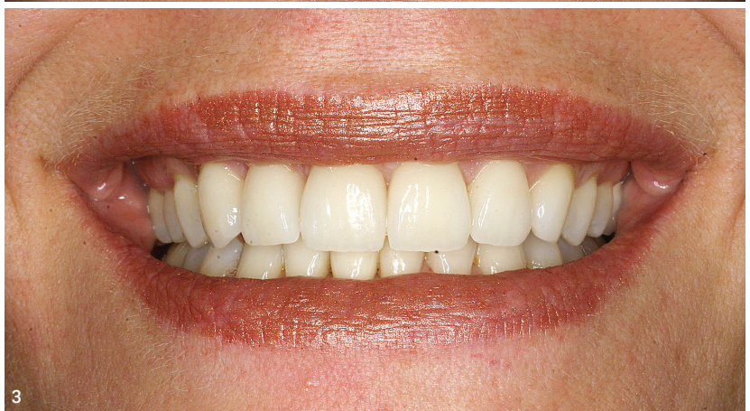
Abb. 1: 79-jährige Patientin: Falten unterspritzt, Lippen mit Permanent-Make-up verbreitert, zu starke Überdeckung der OK-Front durch die Oberlippe, kurze Frontzahnkronen, negative Lachkurve. Abb. 2: Starke Faltenunterspritzung der Lippen und des Gesichts. Kurze Oberkieferfront. Abb. 3: Kombibehandlung KFO/Prothetik (Vollkeramikronen), große und lange Schneidezahnkronen, geringe Abdeckung der OK-Front durch die Oberlippe, positive Lachkurve.