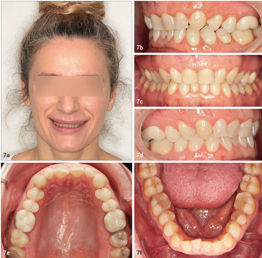
Fall 2: Abb. 7a–f: Klinische Ausgangssituation: 45-jährige Patientin, faltenunterspritzte Oberlippe, geringe Frontzahnexposition der OK-Front, Steilstand der OK/UK-Front, Tiefbiss, skelettal Klasse I.