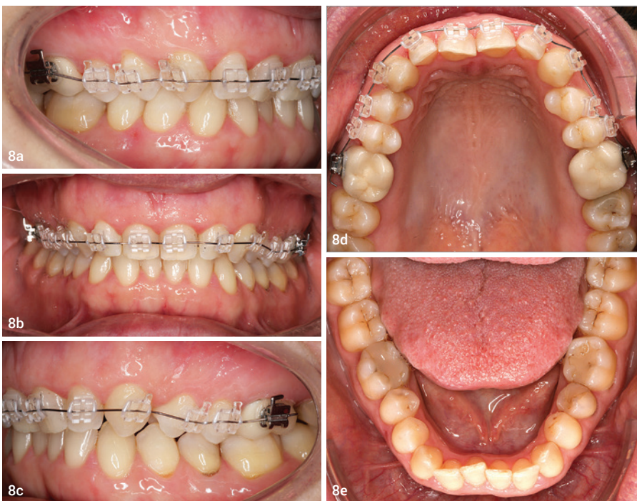
Abb. 8a–e: Erste Behandlungsphase: Eingliederung der Multibracketapparatur im Oberkiefer mit Saphirbrackets.

der Betrachter die Frontzähne von vorn beurteilt, da sich diese durch die Perspektive die Zahnbreiten der seitlichen Schneidezähne und Eckzähne aufgrund des Oberkiefer-Kurvenverlaufs optisch anders darstellen, als sie tatsächlich sind. Folgende Indikationen können eine Verlängerung und eine damit einhergehende Verbreiterung der Oberkieferfrontzähne notwendig machen: