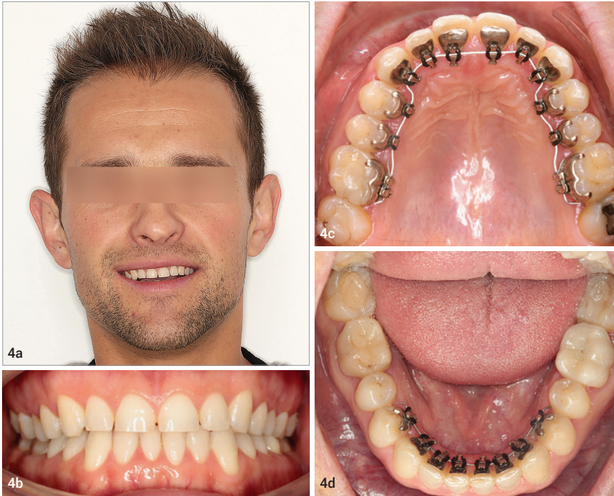
Fall 1: Abb. 4a–d: 32-jähriger Patient: kieferorthopädische Protrusion und Einstellen frontaler Lücken für anschließende Keramikronen in der OK-Front.

Im schlimmsten Falle ist die Oberkieferfront durch die Überlappung der Oberlippe gar nicht mehr zu sehen. Aber woher kommt dieser negative Nebeneffekt der Faltenunterspritzung?