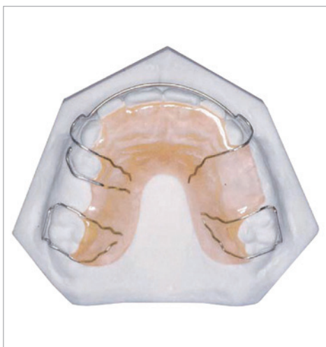
Abb. 2: Lückenhalter als herausnehmbare Apparatur.