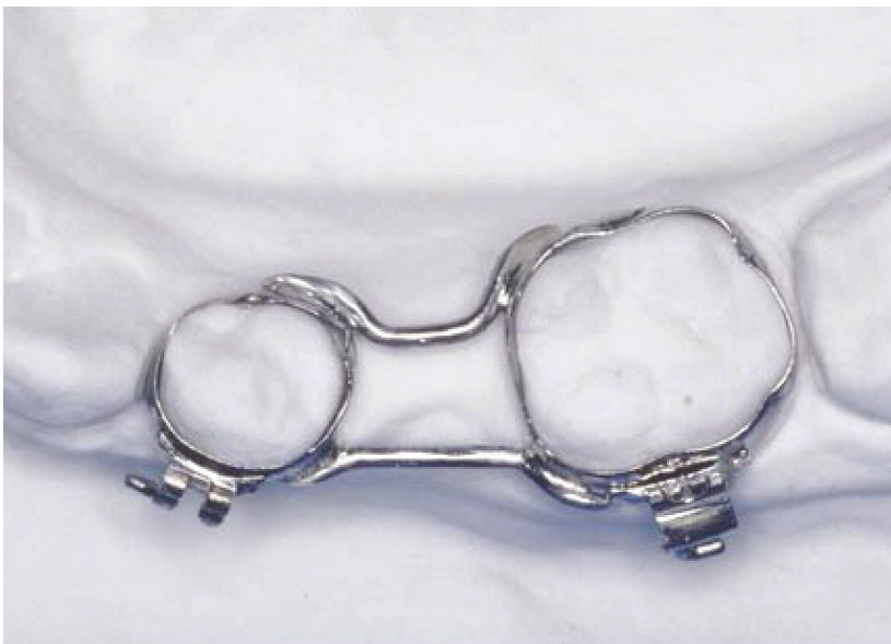
Abb. 3: Festsetzender Lückenhalter, gelötet an Bändern.

eine kieferorthopädische Maßnahme. Ein Lückenhalter kann herausnehmbar (Abb. 2) gefertigt werden (dann handelt es sich um eine Kassenleistung) oder festsetzend (Abb. 3) (Privatleistung). Wenn man einen herausnehmbaren Lückenhalter über die gesetzliche Krankenversicherung (GKV) abrechnen möchte, dann ist unbedingt darauf zu achten, dass er keine aktiven Elemente enthält, also weder „Federn“ noch „Dehnschrauben“. Apropos Schraube: Eine im herausnehmbaren Lückenhalter eingearbeitete Wachstumsschraube ist beim Kassenpatienten abrechenbar! Das ist vielen Praxen nicht bekannt! Nur eine als „Wachstumsschraube“ gekennzeichnete Schraube, die das natürliche Wachstum des Kiefers nicht blockiert, wird von den meisten KVZen akzeptiert. Alle Praxisteams, die diesbezüglich unsicher sind, sollten bei ihrer zuständigen KZV klären, ob sie die „Wachstumsschrauben“ innerhalb der Lückenhalter-Laborabrechnung berechnen dürfen. Diese Abrechnungsfrage, die immer wieder im Rahmen der Kassenlaborabrechnung nach BEL II auftaucht, wurde bereits Anfang 2016 zwischen GKV-Spitzenverband, VDZI und KZBV geklärt. (KFO-Management Berlin hat bereits in der Fachbroschüre KFO-KOMPAKT 10/2016 darüber berichtet.)