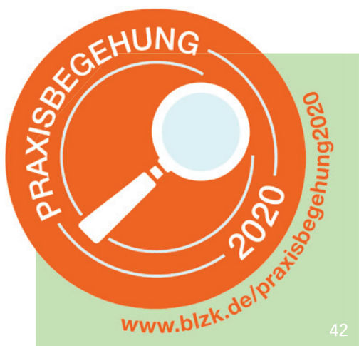
Die Ergebnisse der Praxisbegehungen sind für alle Zahnarztpraxen relevant.