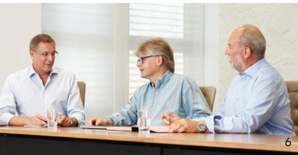
Der KZVB-Vorstand zieht zum Ende der Amtszeit Bilanz.