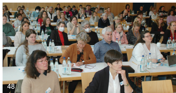
Großes Interesse herrschte bei der Gruppenprophylaxe-Fortbildung der LAGZ in Herrsching.