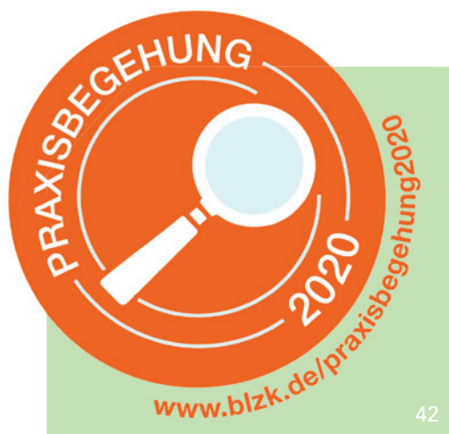
Die Ergebnisse der Praxisbegehungen sind für alle Zahnarztpraxen relevant.