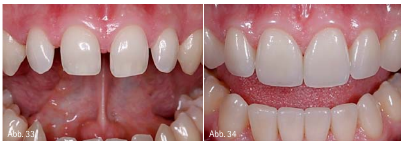
Abb. 33: Junger Patient mit multiplen Diastemata an karies- und füllungs-freien Zähnen. – Abb. 34: Mit den adhäsiv befestigten Keramikveneers konnte auf minimalinvasive Weise eine deutliche Verbesserung der Ästhetik erzielt werden (Zahntechnik: Hubert Schenk, München).

welche man von Keramikveneers erwarten darf.