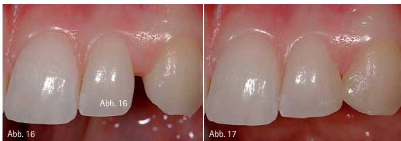
Abb. 16: Ausgangssituation: Zahnücke im Oberkiefer zwischen seitlichem Schneidezahn und Eckzahn. – Abb. 17: Fertiggestelltes Mock-up: Mit einem plastischen Komposit wird vom Zahnarzt direkt am Patienten die Behandlung mit Veneers simuliert.

nicht von der augenblicklichen Zahnstellung determiniert wird. Der Abtrag erfolgt kontrolliert durch den Einsatz von Tiefenmarkierungen, welche die Außenkontur des Mock-ups im zervikalen, mittleren und inzisalen Zahndrittel berücksichtigen. Die Präparation findet ausschließlich an den dafür notwendigen Stellen statt und sichert somit einen ökonomischen Umgang mit gesunder Zahnschubstanz. Hierdurch ergibt sich in Fällen mit Veränderung der Zahndimensionen (Form, Stellung) ein großer Vorteil gegenüber der Methodik, bei welcher der Substanzabtrag allein durch die Verwendung von Tiefenmarkierungsdiamanten ohne zusätzlichen Schabloneneinsatz bestimmt wird.