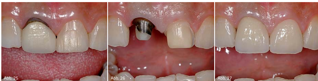
Abb. 25: Patient mit unästhetischen Versorgungen der mittleren Schneidezähne im Oberkiefer. – Abb. 26: Sehr stark verfärbte Zähne (hier: Zahn 11) werden besser durch eine Vollkrone therapiert, um ein „Durchscheinen“ zu verhindern. Zahn 21 wurde für ein Veneer präpariert. – Abb. 27: Durch die Zirkonoxidkrone an Zahn 11 und das Keramikveneer an Zahn 21 wurde die Funktion und Ästhetik der Zähne wiederhergestellt (Zahntechnik: Hubert Schenk, München).

ist (Abb. 19). Anschließend werden die Kunststoffreste entfernt und zur besseren Visualisierung des weiter durchzuführenden Hartschubabtrags der Grund der Tiefenmarkierungen im Schmelz mit einem wasserfesten Stift markiert (Abb. 20). Dieses Vorgehen nach dem Prinzip des „Backward Planning“ erlaubt einerseits den schonenden Umgang mit natürlicher Zahnschmelz und garantiert andererseits einen der jeweiligen Materialauswahl entsprechenden Abtrag zur Sicherstellung der Restaurationsstabilität. Die vestibuläre Zahnfläche wird unter Beibehaltung der anatomischen Form auf dieses hiermit bestimmte Niveau reduziert. Eine Veneerschichtstärke unter 0,3 mm ist nicht zu empfehlen, da ansonsten die Restauration zu bruchgefährdet ist. Bei dunklen Zähnen ist ein zusätzlicher labialer Abtrag von 0,2 mm anzuraten, um die Verfärbungen ausreichend zu maskieren (Abb. 21 und 22). Ein Silikon-