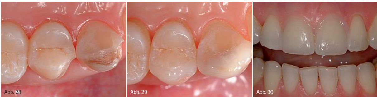
Abb. 28: Präparation für ein Veneer an einem ersten Prämolaren. – Abb. 29: Adhäsiv befestigtes Keramikveneer am ersten Prämolaren. Situation nach drei Monaten (Zahn-technik: Hubert Schenk, München). – Abb. 30: Ästhetische Einprobe von Keramikveneers an den Zähnen 11 und 21 mit Try-in-Paste.

der Gesamteindruck künstlich und „fliesenartig“ wirkt. Generell sollten sehr stark verfärbte Zähne besser mit einer Krone beispielsweise aus Zirkonoxidkeramik (opakeres Kronenkäppchen zur Maskierung und darüberliegende natürliche Schichtung mit transluzenter Verblendkeramik) versorgt werden (Abb. 25–27). Ist der stark verfärbte Zahn endodontisch behandelt, so kann hier die Präparation für die Krone im Randbereich, zumindest im ästhetisch wichtigen labialen Areal, etwas ausgeprägter als die sonst empfohlenen 1,0 mm durchgeführt werden. In diesem Fall kann eine Präparationstiefe von etwa 1,2 bis 1,3 mm ohne Gefahr für die Pulpa angestrebt werden. Dies gibt dem Zahntechniker die Möglichkeit, eine ausreichend opake Zirkonoxidkappe von 0,5 bis 0,6 mm Schichtstärke anzufertigen und gleichzeitig immer noch genügend Platz für eine lebendig wirkende Verblendung zu haben.