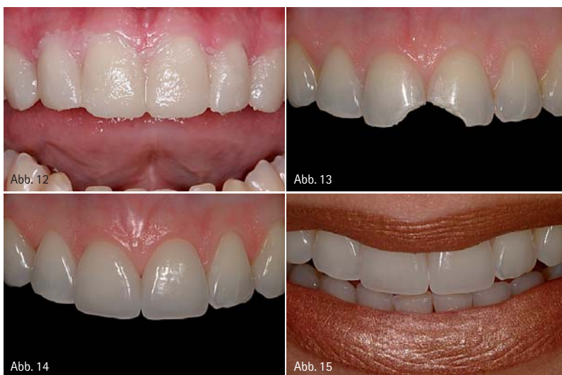
Abb. 12: Mit der diagnostischen Schablone werden die Konturen des Wax-up in das intraorale Mock-up (mit Provisoriumkunststoff) übergeführt. – Abb. 13: Patientin mit unfallbedingten Frakturen an beiden mittleren Schneidezähnen im Oberkiefer. – Abb. 14: Auf Wunsch der Patientin erfolgte die Restauration mit Keramikveneers (Zahntechnik: Hubert Schenk, München). – Abb. 15: Lippenbild nach Behandlungsabschluss.

staltung der Oberflächentextur. Eine für den jeweiligen Patienten spezifische, optimale Zahnstellung und Form der Veneers wird angestrebt. Die Dokumentation der Ausgangssituation mit digitaler Fotografie und schädelbezüglich einartikulierten Planungsmodellen ist unbedingt zu empfehlen. Bei geplanten größeren Veränderungen ist zudem eine sorgfältige Modellanalyse unverzichtbar. Die Kombination aus Wax-up, Mock-up und Tiefenmarkierungen ist nachfolgend in der Umsetzung der Präparation von unschätzbarem Wert und sichert einen