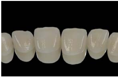
Abb. 5: Vollkeramische Veneers für die Restauration von Oberkieferfrontzähnen. Die Schichtstärke beträgt circa 0,7 mm.

Die Präparation findet normalerweise überwiegend auf der labialen Seite statt. Der deutlich reduzierte Abtrag an Zahnhartsubstanz hat für den Patienten erhebliche Vorteile: Neben der Schonung gesunder Zahnhartsubstanz ist das Risiko von postoperativen Problemen ebenso deutlich reduziert wie die Gefahr eines Vitalitätsverlustes (kurz- und langfristig) des betroffenen Zahnes infolge eines Präparationstraumas.