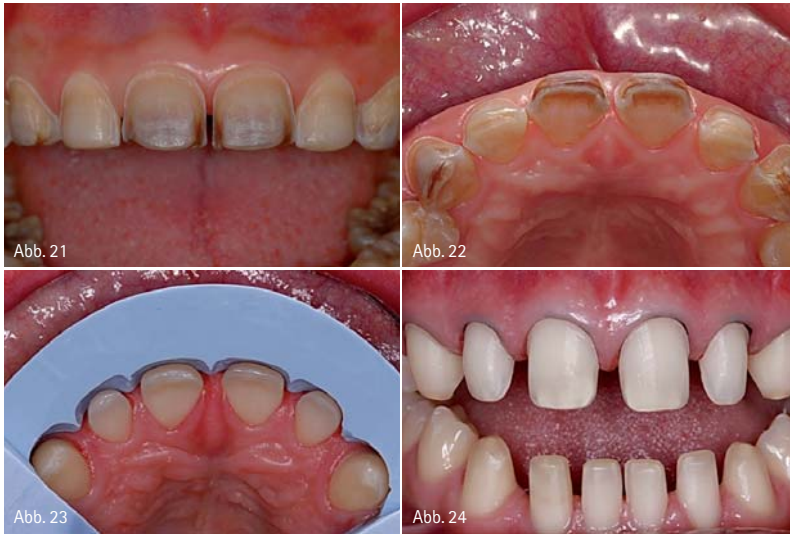
Abb. 21: Veneerpräparationen für verfärbte Zähne im Oberkiefer. Die Präparationen erstrecken sich im Approximalbereich etwas weiter nach oral und der Abtrag ist generell um ca. 0,2 mm tiefer im Vergleich zu unverfärbten Zähnen. – Abb. 22: Ansicht von inzisal. – Abb. 23: Mit dem am Wax-up angefertigten Silikonschlüssel wird der Präparationsabtrag kontrolliert. – Abb. 24: Die Veneerpräparationen zum Schließen der Diastemata erfordern die Einbeziehung der Approximalfächen, um dem Techniker die Möglichkeit zu geben, die Approximalräume neu zu gestalten.

mensionen verbunden, z.B. lediglich eine Korrektur der Oberflächenmorphologie oder der Zahnfarbe, kann der notwendige Abtrag gleich mit speziellen Tiefenmarkierungs-Diamantschleifern festgelegt werden (Abb. 18). In manchen Fällen kann komplett auf eine Präparation des Zahnes verzichtet werden. Diese speziellen Fälle eignen sich zur Anfertigung sogenannter „No Prep“-Veneers. Es handelt sich hierbei meist um kariesfreie Zähne, welche entweder in Relation zu ihren Nachbarn in retrudierter Position stehen, oder aber um entsprechend geeignete dysplastische Zähne. Die Möglichkeit für ein präparationsloses Vorgehen ist am besten in der Planungsphase durch ein Wax-up zu prüfen. Gleichzeitig ist darauf zu achten, dass durch eine derartige Veneerversorgung nicht eine positive Stufe am gingivalen Rand erzeugt wird, welche Ursprung für Plaqueakkumulation und Entzündungsreaktionen des marginalen Parodonts sein kann. Im Folgenden wird das Vorgehen bei der Veneerpräparation näher beschrieben: Nach dem Abschleifen der Zahnbereiche, die gegebenenfalls die Außenkonturen der diagnostischen Schablone überschreiten, wird intraoral der spannungsfreie Sitz der Schablone kontrolliert. Sollte dieser noch nicht gegeben sein, so befindet sich weiter Zahnschmelz außerhalb der Außen-