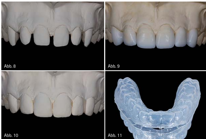
Abb. 8: Planungsmodell für die Anfertigung von Veneers bei einem Patienten mit multiplen Diastemata. – Abb. 9: Präoperativ angefertigtes Wax-up zur Behandlungsplanung und Visualisierung. – Abb. 10: Doubliertes Wax-up als Grundlage für die Herstellung einer diagnostischen Schablone. – Abb. 11: Diagnostische Schablone aus einer tiefgezogenen, transparenten Folie.

tischen Optimums erfordert bereits von Anfang an in der Phase der Behandlungsplanung eine enge Zusammenarbeit mit dem spezialisierten Zahntechniker. Im Rahmen der vor Behandlungsbeginn stattfindenden ausführlichen ästhetischen Analyse wird die Verteilung der verschiedenen Farbschattierungen und der transluzenten/opaken Zahnbereiche im zu restaurierenden Gebiet ebenso ermittelt, wie der altersentsprechende Aufbau der Restaurationen mit entsprechenden individuellen Charakteristika (z.B. Schmelzrisse, White Spots) und die korrekte Ausge-