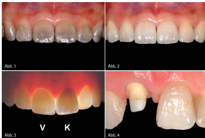
Abb. 1: Dunkel und unästhetisch wirkende Frontzähne im Oberkiefer aufgrund von Tetrazyklineinlagerungen in die Zahnhartsubstanz. Die Zähne weisen weder kariöse Defekte noch Füllungen auf. – Abb. 2: Die adhäsiv befestigten Keramikveneers bewirken eine deutliche Verbesserung der Ästhetik (Zahntechnik: Hubert Schenk, München). – Abb. 3: Vergleich verschiedener Zahnrestaurationen im Durchlicht: Keramikveneer an Zahn 11 (V), Zirkonoxidkrone an Zahn 21 (K), restliche Zähne ohne Behandlung. – Abb. 4: Präparation für eine Vollkeramikkrone mit 1 mm umlaufender Stufe.

Das Therapiespektrum der modernen Zahnheilkunde bietet heute vielfältige Methoden, die Ästhetik der Zähne im Frontzahnbereich mit minimalinvasiven Verfahren wiederherzustellen bzw. zu optimieren. Vollkeramische Veneers in Verbindung mit der adhäsiven Klebtechnik erlauben in geeigneten Fällen eine substanzschonende medizinische und gleichzeitig ästhetische Therapie und können in vielen Situationen die Präparation von Vollkronen im Frontzahnbereich ersetzen (Abb. 1 und 2). Die Abgrenzung des Einsatzbereiches zu direkten Kompositrestaurationen ist andererseits gegeben durch sehr große Frontzahndefekte, anspruchsvolle Farb- und Textursituationen und durch hohe ästhetische Ansprüche der Patienten. Veneers ermöglichen eine herausragende Ästhetik mit einer Lichtführung in der Keramik, welche von der natürlichen Zahnhartsubstanz nicht zu unterscheiden ist (Abb. 3), bei gleichzeitig besonders schonendem Umgang mit gesunder Zahnhartsubstanz. Für die Aufnahme einer herkömmlichen metallkeramischen Krone oder einer ästhetischen Krone aus Vollkeramik muss zirkulär im Bereich der marginalen Stufe bzw. Hohlkehle 1 mm und im Bereich des Zahnäquators bis zu 1,5 mm