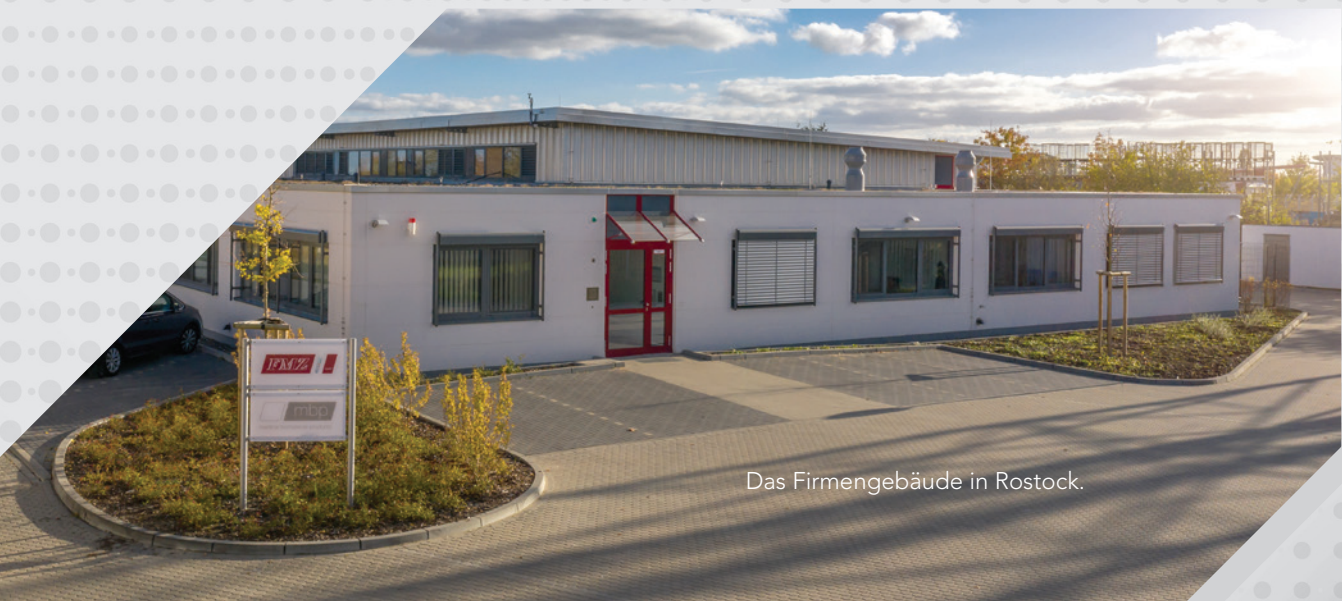
Das Firmengebäude in Rostock.

Für den implantierenden Zahnmediziner, den prothetischen Behandler, wie auch den Zahntechniker fällt eine Orientierung im Marktumfeld der Implantatanbieter zunehmend schwer. Bei der Auswahl des richtigen Implantatsystems stellen sich vielerlei Fragen: Welches ist das richtige System für meine Praxis? Ist es sinnvoll, nur ein System zu verwenden oder ist es besser, mehrere Systeme für unterschiedliche Indikationsbereiche oder Patientengruppen einzusetzen? Wie kann ich möglichst effizient und wirtschaftlich implantologisch tätig sein und meinen Patienten das maximal Mögliche bieten? Genau diese Fragestellungen haben die Entstehung des alphatech® Implantatsystems von FMZ maßgeblich beeinflusst.