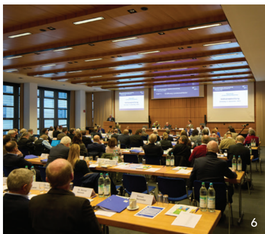
Die Delegierten der Konstituierenden Vollversammlung der BLZK haben eine neue Führungsspitze gewählt.