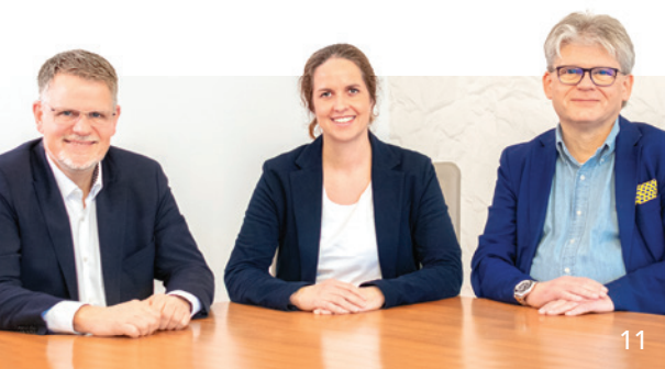
Der neugewählte Vorstand der KZVB spricht im Interview über seine Ziele.