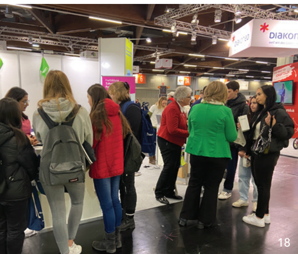
Am Messestand der BLZK bei der BERUFSBILDUNG 2022 in Nürnberg konnten sich Jugendliche über den ZFA-Beruf informieren.