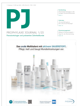
Titelbild: © Bluem Europe/dentalline GmbH & Co. KG