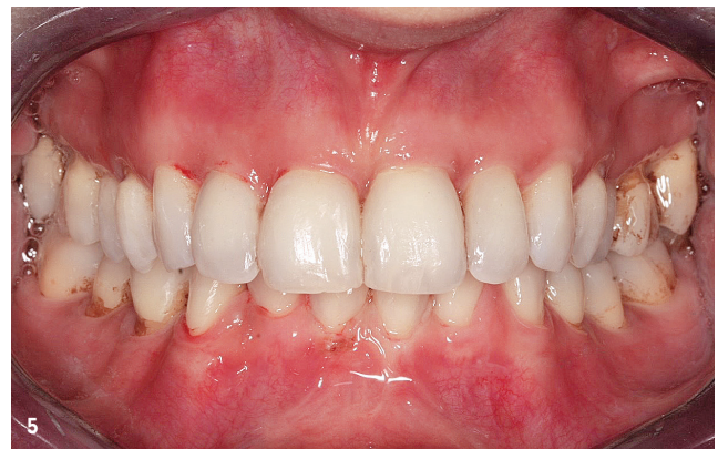
Abb. 2-5: Darstellung von zwei kombiniert parodontologisch-kieferorthopädisch gelösten Patientenfällen. Gerade bei diesen langwierigen Behandlungen ist die Gabe der richtigen Spüllösung der Schlüssel zum Erfolg. Resistenzbildungen müssen hier zwingend vermieden werden.