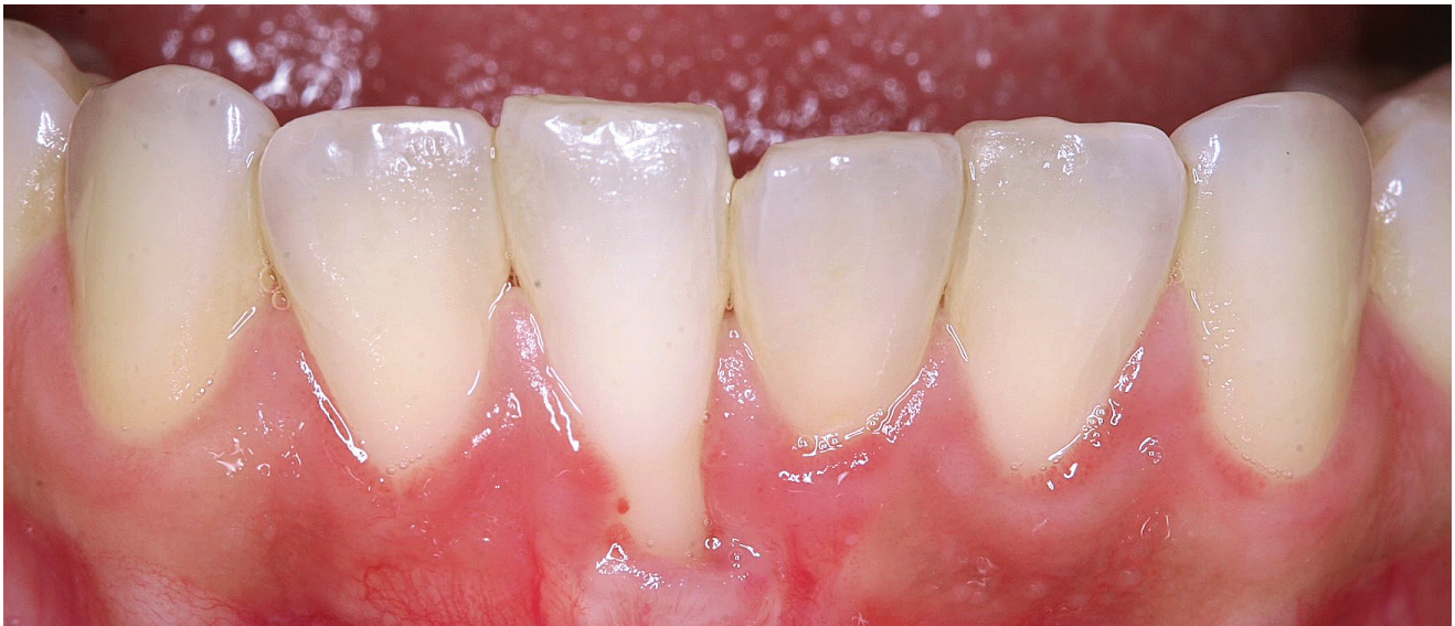
Abb. 6: Darstellung einer typischen Frontzahnrezession. In diesem Fall ist weder eine Chlorhexidin- noch eine Spülung mit Listerine der Schlüssel zum Erfolg, da diese Art der Parodontalproblematik nicht bakteriell bedingt ist.

„Interessant ist, dass diese Wirkung auf die Bakterien nicht nur von der Anwendung von Chlorhexidin abhängt, sondern im besonderen Maße von der Art der Lösung des Chlorhexidins.“