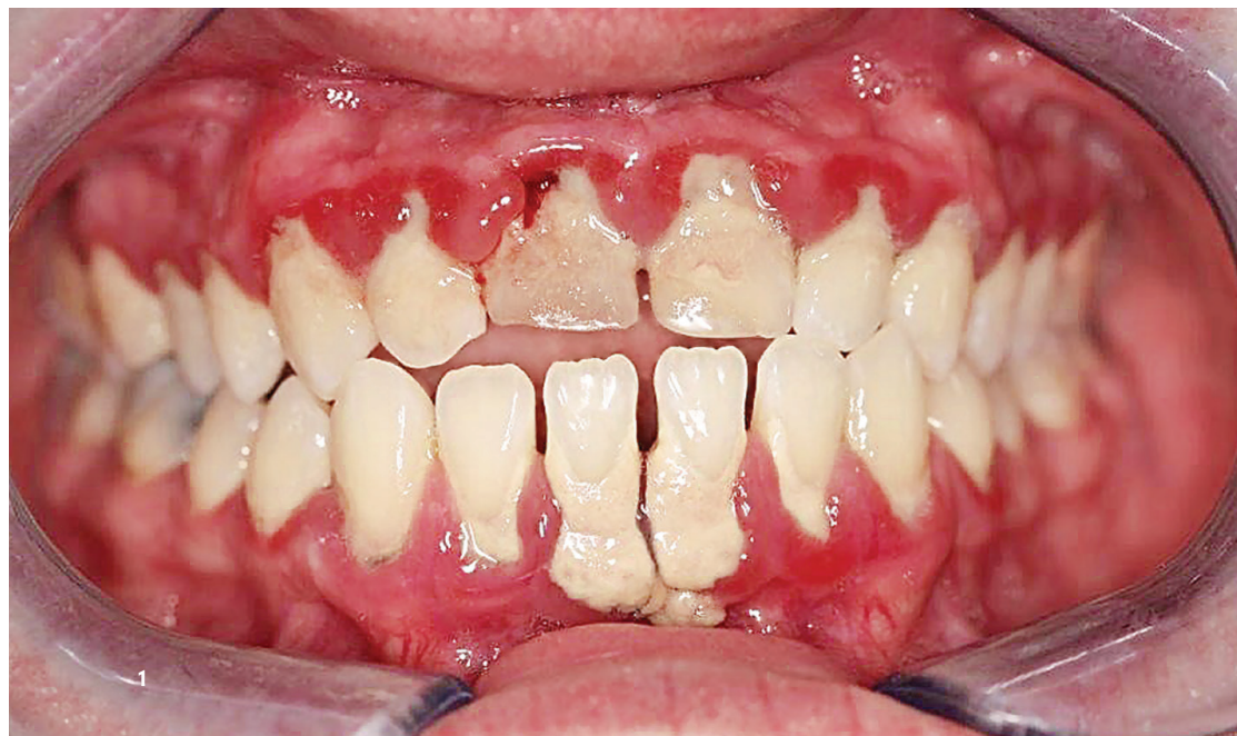
Abb. 1: Darstellung einer parodontalen Exazerbation mit deutlich unzureichender Mundhygiene. Hier kann weder der alleinige Einsatz von Chlorhexidin noch von Listerine Linderung verschaffen. Solche Fälle müssen in der Regel komplex mithilfe von SRP und Antibiotika behandelt werden.

Interessant ist, dass diese Wirkung auf die Bakterien nicht nur von der Anwendung von Chlorhexidin abhängt, sondern im besonderen Maße von der Art der Lösung des Chlor-