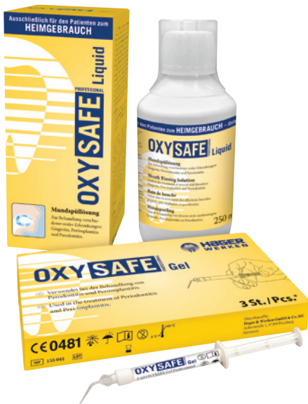
Abb. 1: OXYSAFE Professional für die UPT (Hager & Werken, Duisburg).

Vertrauen der Patienten in die Therapievor schläge der Praxis gestärkt. Gute und rasche Heilungserfolge sind Motivationsverstärker sowohl für den Behandler als auch für den Patienten. Prophylaxepaxen, die mit individuellen, innovativen und professionellen Konzepten arbeiten, sollten ihre Patienten über die Möglichkeit einer aktiven Sauerstofftherapie mit OXYSAFE Professional, in Verbindung mit einer Parodontitis- und/oder Periimplantitiserkrankung, aufklären und informieren. Patienten mit Allgemeinerkrankungen wie z.B. Diabetes mellitus, bei denen eine gestörte Wundheilung den Therapieverlauf erschweren kann, profitieren von der Applikation und dem anschließenden häuslichen Spülen mit OXYSAFE Professional Liquid, ganz ohne Nebenwirkungen. Im Nachgang erleben wir hierdurch viele positive Weiterempfehlungen aus dem Kreis unserer Patienten. Ich arbeite bereits seit einigen Jahren mit OXYSAFE Professional und schätze die einfache, schmerzlose und effiziente Ap-