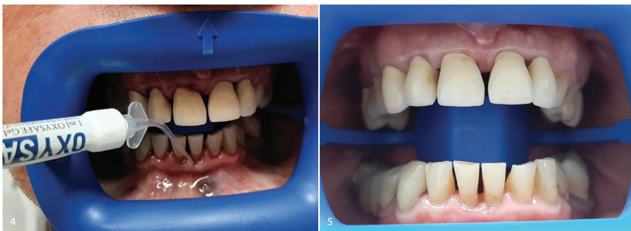
Abb. 4: Das mukoadhäsive Gel klebt leicht im Defekt und entfaltet seine Wirkung nach Kontakt mit Wasser bzw. Speichel. Abb. 5: Bereits deutlich verändertes Bild des Weichgewebes nur zwei Wochen nach Behandlung.

taschen verblieb (Abb. 4). Zur häuslichen Unterstützung erhielt der Patient die Spüllösung OXYSAFE Professional Liquid mit dem Hinweis, diese unverdünnt zweimal dreimal täglich anzuwenden. Bereits zwei Wochen später zeigte sich in der ersten parodontalen Nachsorge bei Befundaufnahme eine starke Verbesserung zur Ausgangssituation (Abb. 5). Der Patient bemerkte den Rückgang der Schwellung und Blutung. In der zweiten PAN (Parodontalnachsorge), nun vier Wochen nach Applikation von OXYSAFE, war die Gingiva bereits hellrosa und straff anliegend.