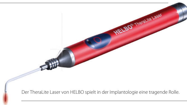
Der TheraLite Laser von HELBO spielt in der Implantologie eine tragende Rolle.

und sterilisierten Sonden entsteht kein zusätzliches Risiko während der OP. Die Reduktion der Komplikationen und die schnellere und bessere Geweberegeneration führen auch zu wirtschaftlich positiven Effekten in der Praxis, da die Behandlung von Komplikationen den Patienten in der Regel nicht in Rechnung gestellt werden kann und ungeplante sowie Notfallbesuche entfallen.