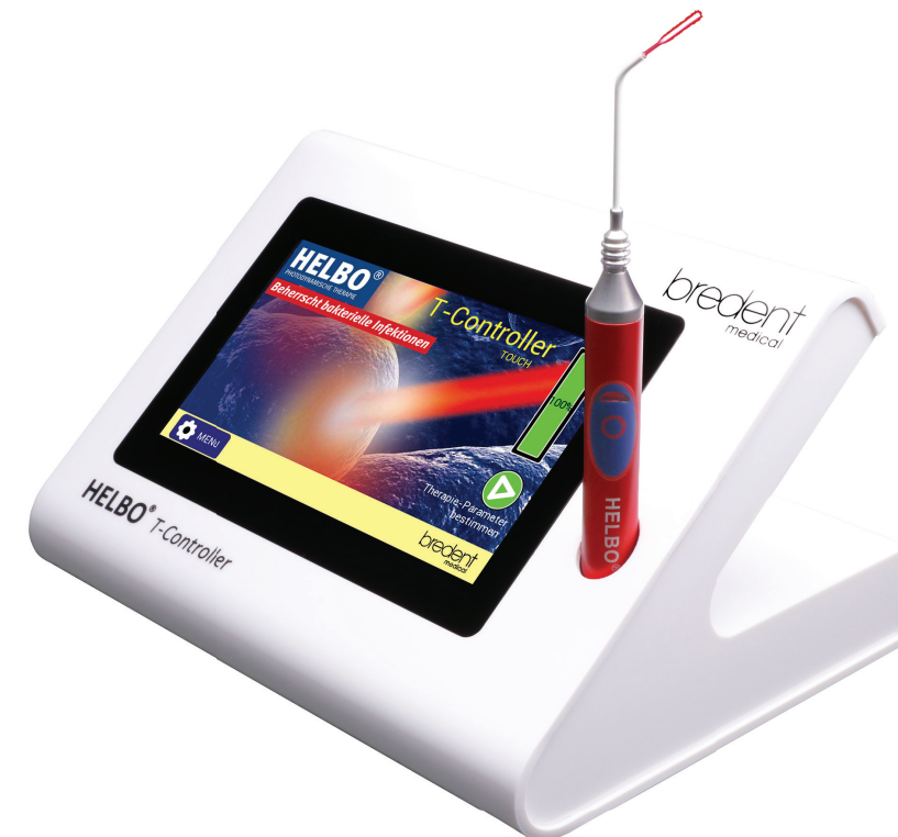
Die Behandlung mit HELBO ermöglicht eine sichere und saubere Implantologie.

Ein weiterer Vorteil der aPDT ist der Zeitfaktor: Die Desinfektion mit HELBO in der Chirurgie verlängert die Behandlungszeit lediglich um 5 bis 10 Minuten – abhängig von der Anzahl der extrahierten Zähne. Durch den Einsatz von sterilem Farbstoff