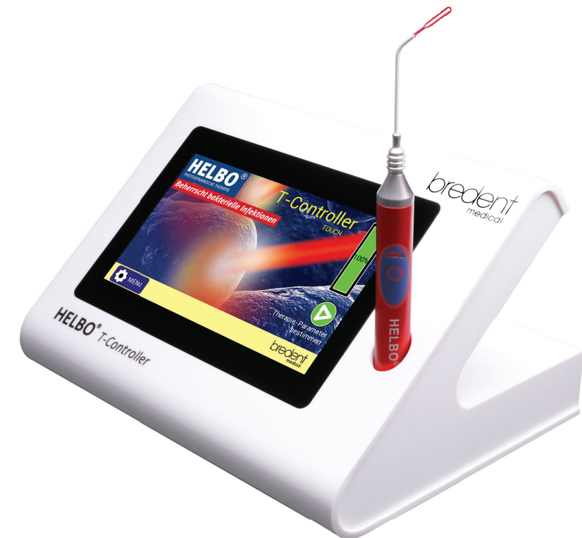
Die Behandlung mit HELBO ermöglicht eine sichere und saubere Implantologie.

Ein weiterer Vorteil der aPDT ist der Zeitfaktor: Die Desinfektion mit HELBO in der Chirurgie verlängert die Behandlungszeit lediglich um 5 bis 10 Minuten – abhängig von der Anzahl der extrahierten Zähne. Durch den Einsatz von sterilem Farbstoff