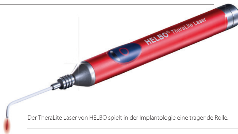
Der TheraLite Laser von HELBO spielt in der Implantologie eine tragende Rolle.

und sterilisierten Sonden entsteht kein zusätzliches Risiko während der OP. Die Reduktion der Komplikationen und die schnellere und bessere Geweberegeneration führen auch zu wirtschaftlich positiven Effekten in der Praxis, da die Behandlung von Komplikationen den Patienten in der Regel nicht in Rechnung gestellt werden kann und ungeplante sowie Notfallbesuche entfallen.