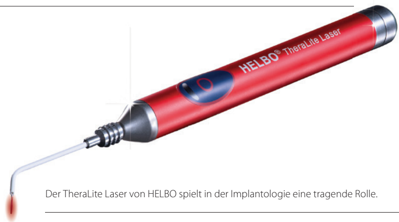
Der TheraLite Laser von HELBO spielt in der Implantologie eine tragende Rolle.

und sterilisierten Sonden entsteht kein zusätzliches Risiko während der OP. Die Reduktion der Komplikationen und die schnellere und bessere Geweberegeneration führen auch zu wirtschaftlich positiven Effekten in der Praxis, da die Behandlung von Komplikationen den Patienten in der Regel nicht in Rechnung gestellt werden kann und ungeplante sowie Notfallbesuche entfallen.