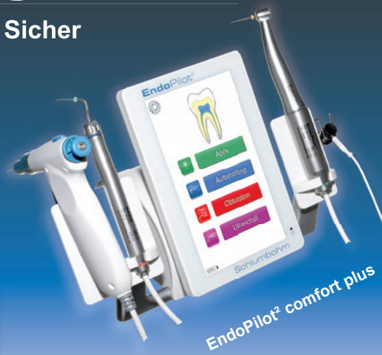
EndoPilot 2 comfort plus