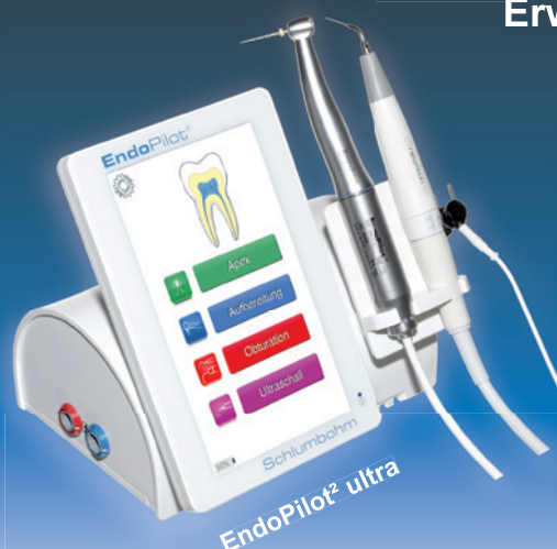
EndoPilot 2 ultra