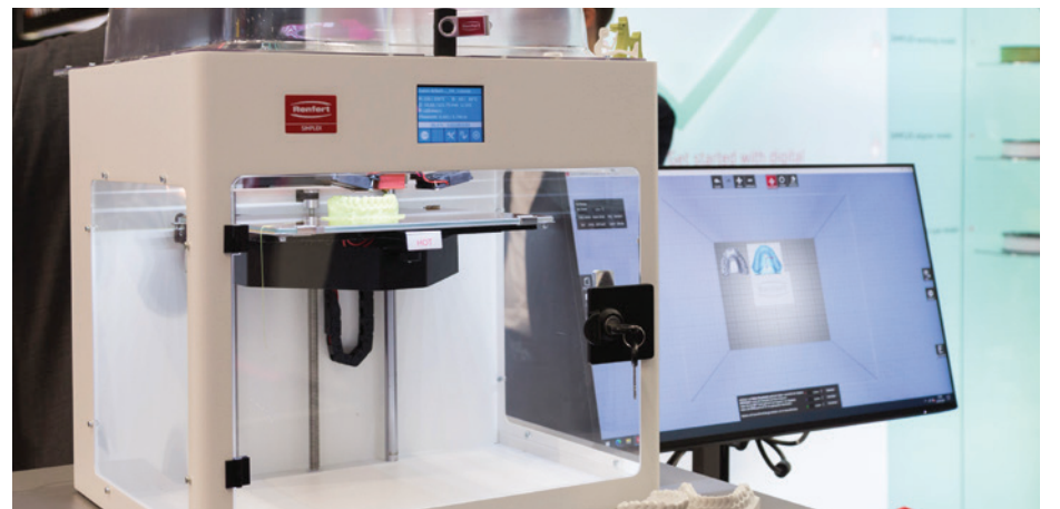
Im digitalen Workflow gewinnen 3D-Druck-Systeme an Bedeutung.

Führend zu sein, ist ein hoher Anspruch. Die IDS erfüllt ihn seit Jahrzehnten, treibt damit Wettbewerb, Innovation und das gesamte Geschäft in der Dentalbranche an und erweist sich in Krisenzeiten als Fels in der Brandung. Zur 40. IDS werden sich mehr als 1.800 Aussteller aus aller Welt in Köln mit ihren Produkten und Systemlösungen der Dentalbranche präsentieren. Herzlich willkommen zu „100 Jahre IDS - shaping the dental future!“ ◀