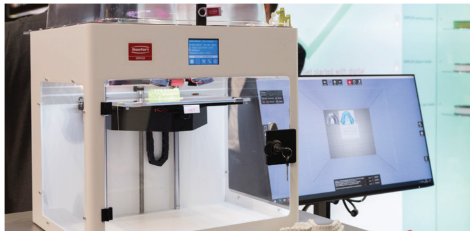
Im digitalen Workflow gewinnen 3D-Druck-Systeme an Bedeutung.

Führend zu sein, ist ein hoher Anspruch. Die IDS erfüllt ihn seit Jahrzehnten, treibt damit Wettbewerb, Innovation und das gesamte Geschäft in der Dentalbranche an und erweist sich in Krisenzeiten als Fels in der Brandung. Zur 40. IDS werden sich mehr als 1.800 Aussteller aus aller Welt in Köln mit ihren Produkten und Systemlösungen der Dentalbranche präsentieren. Herzlich willkommen zu „100 Jahre IDS - shaping the dental future!“ ◀