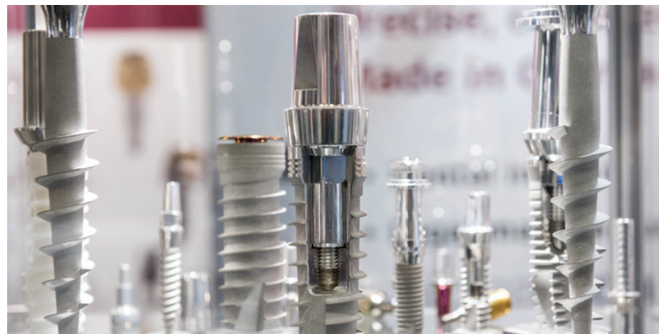
Digitale Workflows zählen in Endodontie, Implantologie und anderen Teildisziplinen der Zahnheilkunde zu den grundlegenden Verfahren.

Immer mehr Anwender digitalisieren konsequent ihre Arbeitsweise durch. Die Abformung mit dem Intraoralscanner und sein erweiterter Indikationsbereich sorgen für eine hohe Dynamik. Ganzkieferscans oder Scans einzelner Kieferkämme, Schleimhautscans und das Matchen mehrerer separater Scans - das alles rückt in den Bereich des Machbaren. Die Grenzen verlaufen bei sehr stark subgingivalen Versorgungen und beim direkten Übersetzen eines Intraoralscans in funktionelle Bewegungen, wie man sie etwa für die „digitale Totalprothese“ benötigt.