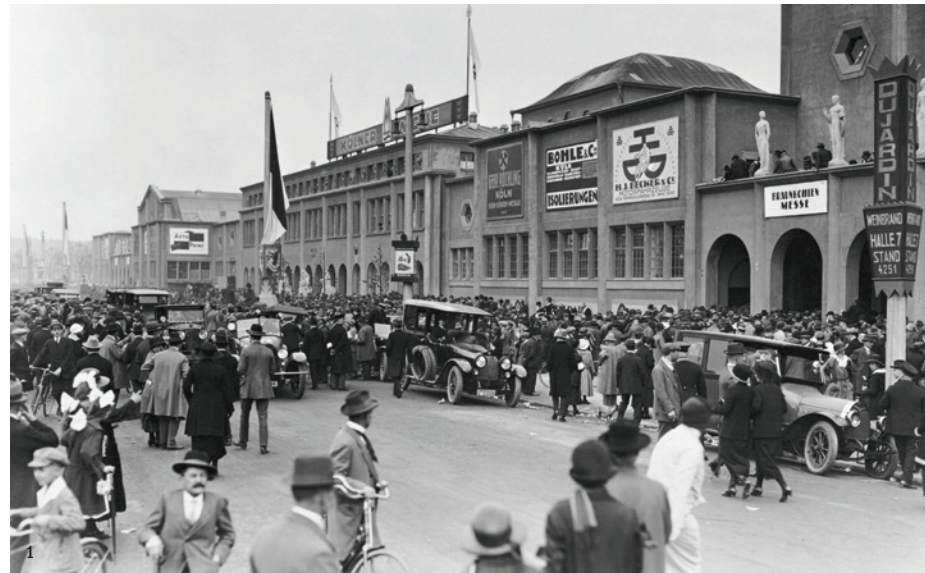
Abb. 1: Der Andrang auf der Frühjahrsmesse ist groß. Nicht alle Anmeldungen von Ausstellern können berücksichtigt werden. Abb. 2: Die Südfassade der Rheinhallen während der Frühjahrsmesse. Abb. 3: Für die Kölner sind Messen eine willkommene Abwechslung vom Nachkriegsalltag. Abb. 4: Das wachsende Messegelände wird in den 1960er-Jahren an die Autobahn angeschlossen.

Viele Veranstaltungen entwickelten sich zu führenden Leitmesen ihrer Branchen. Die Messengesellschaft expandierte weiter: Bis 1961 standen 100.000 Quadratmeter Hallenfläche zur Verfügung. Die Herren-Mode-Woche und die Baby (Vorläufer der Kind + Jugend) feierten in dieser Dekade ihre Premieren, die Haushalts- und Eisen-