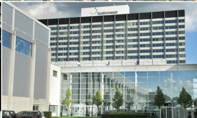
Abb. 5: Der Eingang Ost. Abb. 6: Prinz Charles besucht die Handelsmesse „Best of Britain“ und verleiht der Koelnmesse royalen Glanz. Abb. 7: In nur 14 Monaten entstehen ab September 2004 die Nordhallen. Abb. 8: Das Messehochhaus wird neuer Arbeitsplatz der Koelnmesse-Mitarbeiter. Abb. 9: Die Koelnmesse verfügt über das fünftgrößte Messegelände der Welt.