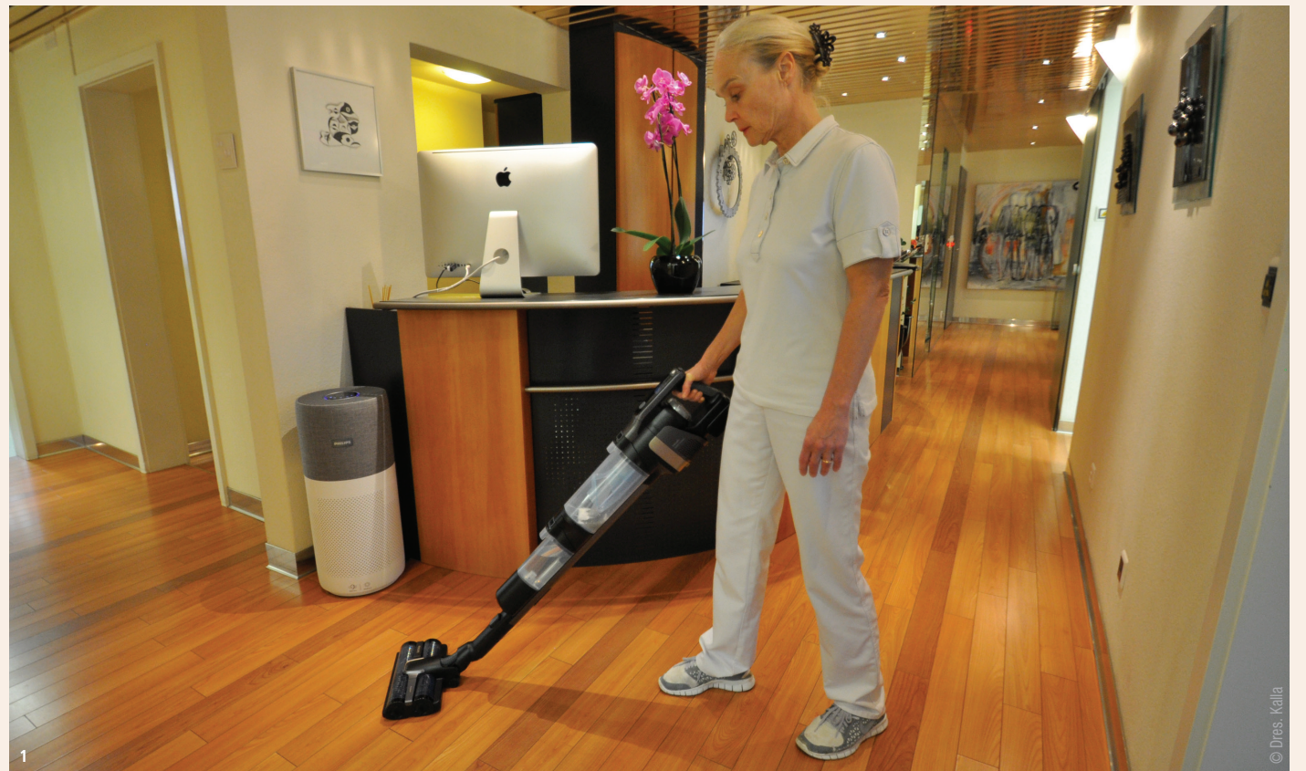
Abb. 1: Die Komplettlösung für hygienische Reinigung: AquaTrio 9000 Trocken-Nass-Akku-Staubsauger im Praxiseinsatz.

Für die Mitarbeiter kann durch ein Wechseln des Schuhwerks nahe des Eingangsbereichs die entsprechende Kontamination in die nur für das Personal zugänglichen Bereiche bedingt reduziert werden, vor allem, wenn ein separater privater Personalzugang in die Praxisräumlichkeiten vorhanden ist. Die Patienten aber bringen über ihr Schuhwerk eine unberechenbare Kontamination der Praxisböden mit, welche diese in allen ihnen zugänglichen Bereichen verteilen und das Personal anschließend über das eigene Schuhwerk weiter in der gesamten Praxis verbreitet: auch in die Behandlungsräume.