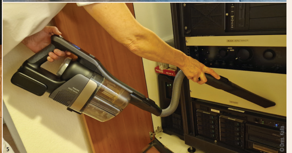
Abb. 2: Nass-/Trockensauger-Modul 2 – aus einem speziellen Wasserbehälter fließt durchgehend sauberes Wasser auf den Boden und wird von den beiden Power-Bürsten sofort wieder aufgenommen. – Abb. 3: Die LED-Leuchten an der Saugdüse machen versteckten Schmutz sichtbar. – Abb. 4: Das Staubsauger-Modul kann ganz einfach von einem Akku-Staubsauger in einen praktischen Handstaubsauger umgesteckt werden. – Abb. 5: Handstaubsauger-Modul mit flexiblem Extensionsschlauch.