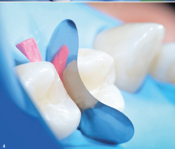
Abb. 1: PolydentiaPRO Interproximale Zahnschutzmatrize. – Abb. 2: myQuickmat All-round Vollmatrizensystem. – Abb. 3: myQuickmat Forte Teilmatrizensystem. – Abb. 4: QuickmatFLEX Titan-Teilmatrizen.