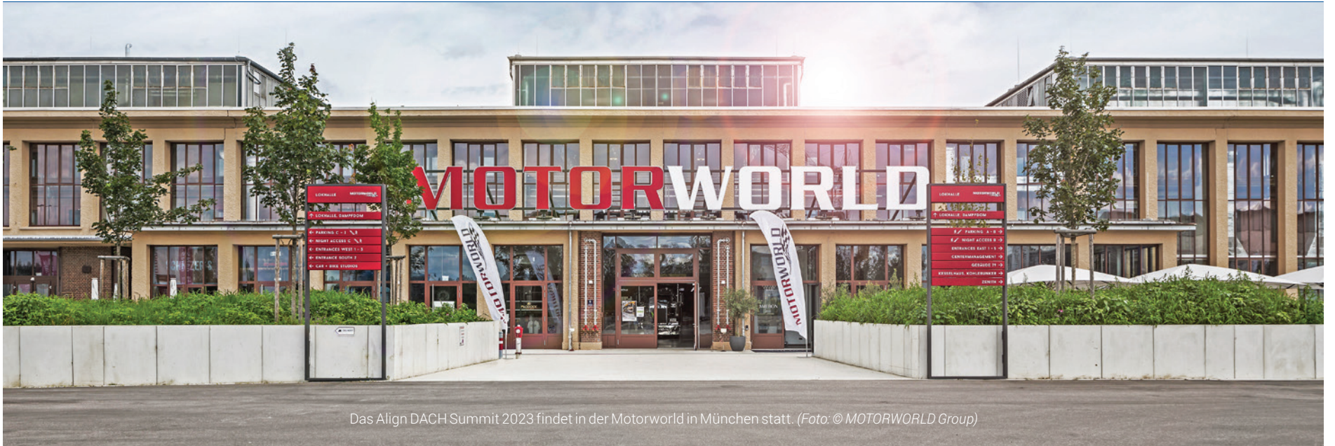
Das Align DACH Summit 2023 findet in der Motorworld in München statt.