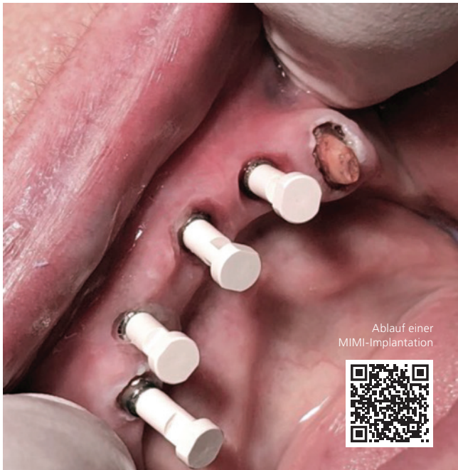
MIMI – einer der Erfolgsschlüssel zahnärztlicher Implantationen.