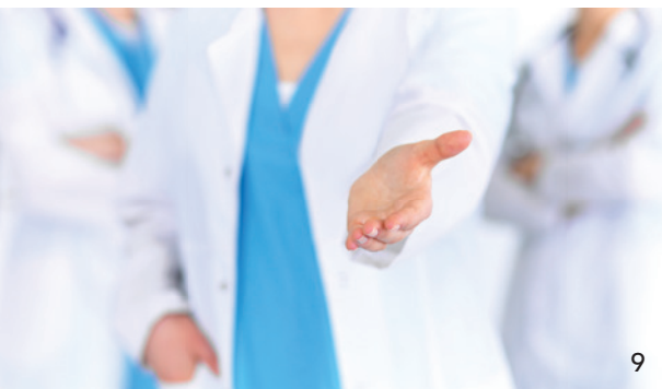
Höchste Anerkennung, aber kein Bonus – Bayerns Gesundheitsminister Holetschek lehnt den von der BLZK geforderten Corona-Bonus ab.