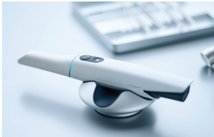
• 3Shape TRIOS 5.

„Jede 3Shape-Lösung ist das Ergebnis unserer Zusammenarbeit mit Zahn- und Labortechnikern. Der 3Shape F8-Scanner zum Beispiel war sechs Jahre in der Entwicklung. Der Input kam nicht nur von unseren Designern und Ingenieuren, sondern auch von den Labortechnikern selbst. 3Shape hat Hunderte von Labormitarbeitern auf der ganzen Welt befragt, um ge-