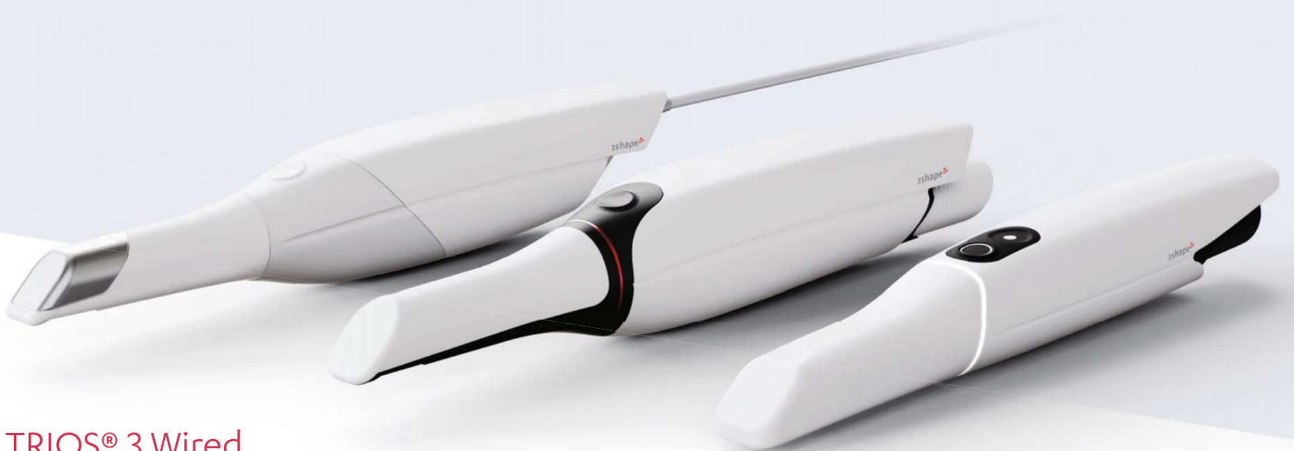
TRIOS® 3 Wired