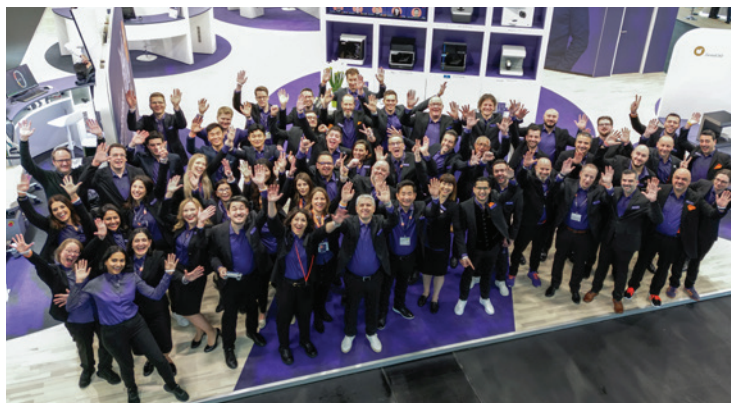
» Das exocad-Team am Stand auf der IDS. » Exocad team at IDS booth.

Die Smile Creator Experience von exocad steht dabei im Mittelpunkt: In einer Live-Vorführung wird die Verwendung des Smile Creator Schritt für Schritt gezeigt. » 2