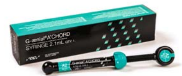
G-ænial A'CHORD Light-cured universal restorative composite