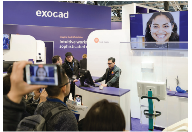
•Exocad's Smile Creator Experience.

To support laboratories looking to outsource overflow work and ex-