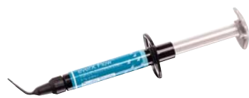
everX Flow Short-fibre reinforced flowable composite