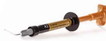
G-ænial Universal Injectable High-strength restorative composite