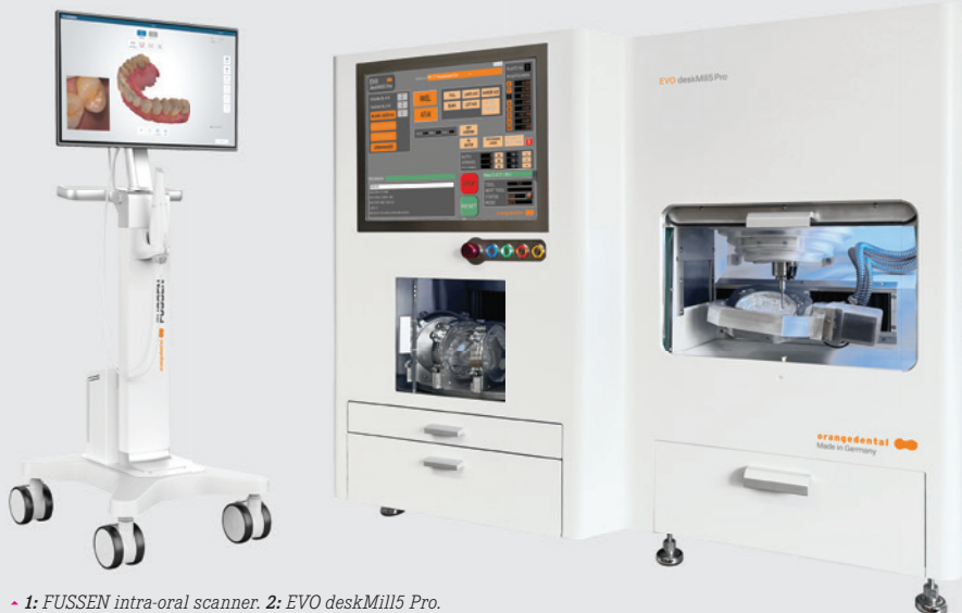
1: FUSSEN intra-oral scanner. 2: EVO deskMill Pro.

Also on show at IDS will be the company’s innovations in the field of radiography. Among these is the Green 2, a first-class professional entry-level CBCT unit with a field of view of up to 10×8 cm. The well-known PaX-i dental panoramic tomogram machine has found a successor in the PaX-i Plus, which features a new design. The EzRay AIR W2 is a new intra-oral radiography device that supports Bluetooth transmission of the acquisition parameters. The digital functional analysis that is offered by the newly developed digital Freecorder Nxt and its interface with the exocad Jaw Motion Import module enable dental professionals to create tailor-made products that account for dynamic occlusion. Visit the company’s booth to find out more. ◀◀