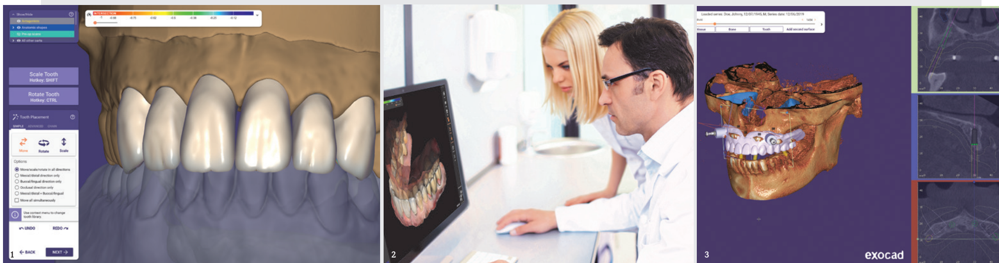
1: DentalCAD. 2: ChairsideCAD. 3: Exoplan.