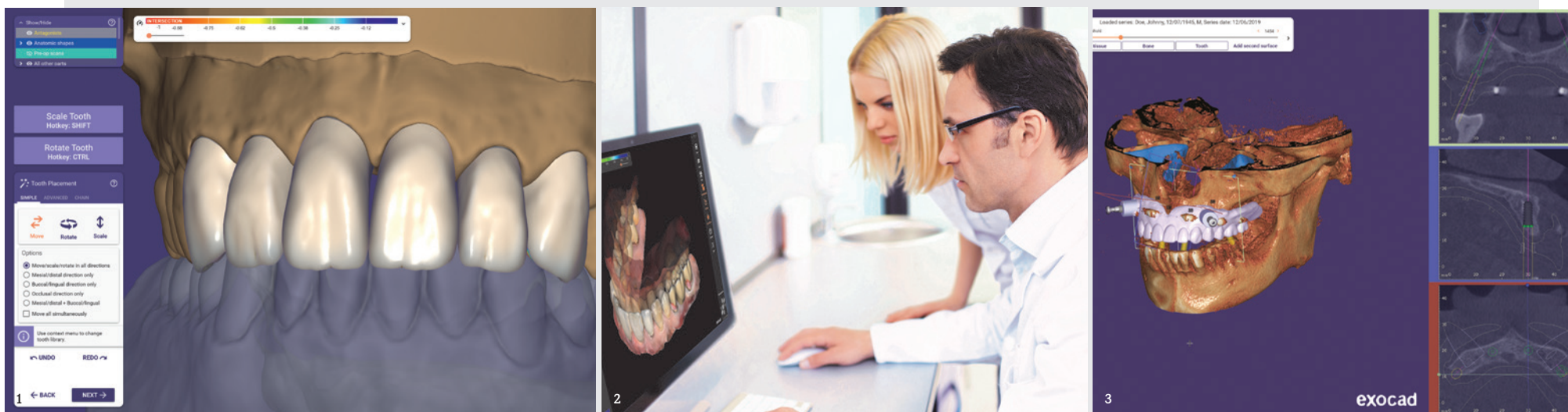
1: DentalCAD. 2: ChairsideCAD. 3: Exoplan.