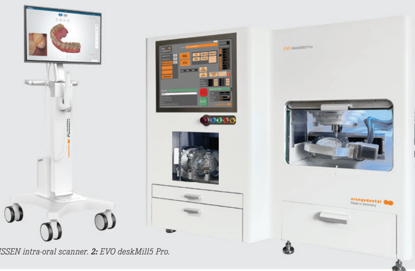
1: FUSSEN intra-oral scanner. 2: EVO deskMill5 Pro.

orangedental, Germany www.orangedental.de Hall 11.2, Booth L020/N029