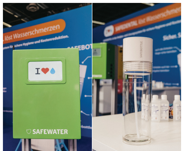
•BLUE SAFETY informiert in Halle 2.2 am Messestand A030/B049 über die gesundheitlichen und wirtschaftlichen Aspekte der Trinkwasserhygiene für zahnmedizinische Einrichtungen. •At Booth A030/B049 in Hall 2.2., IDS visitors can learn more about the health and economic aspects of drinking water hygiene in the dental setting.

We are a medical device manufacturer, an expert in electrochemistry and a registered sanitary company. Based on this expertise,