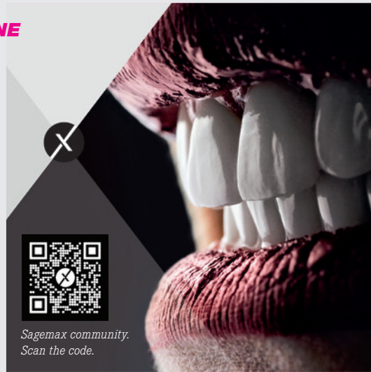
Sagemax community. Scan the code.

The aim of the Sagemax community platform is to promote exchange of knowledge and experience among dental technicians and dentists across countries and disciplines. Community members are here to support each other with tips and tricks and to explain procedures and workflows. Sagemax provides participants a stage to