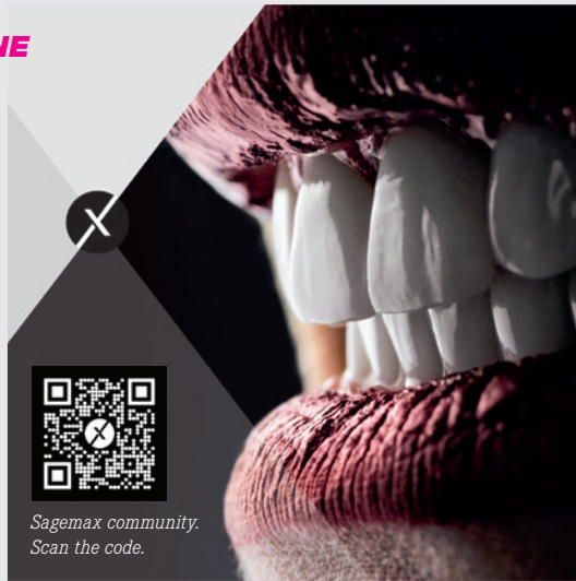
Sagemax community. Scan the code.

The aim of the Sagemax community platform is to promote exchange of knowledge and experience among dental technicians and dentists across countries and disciplines. Community members are here to support each other with tips and tricks and to explain procedures and workflows. Sagemax provides participants a stage to