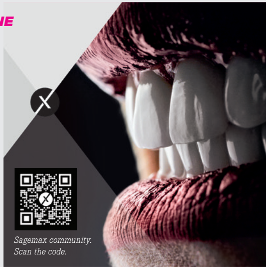
Sagemax community. Scan the code.

The aim of the Sagemax community platform is to promote exchange of knowledge and experience among dental technicians and dentists across countries and disciplines. Community members are here to support each other with tips and tricks and to explain procedures and workflows. Sagemax provides participants a stage to