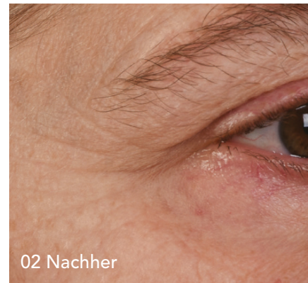
02 Kritterfältchen, vor und nach einer Medical Needling-Behandlung. Resultate können variieren, je nach individueller Ausgangssituation.