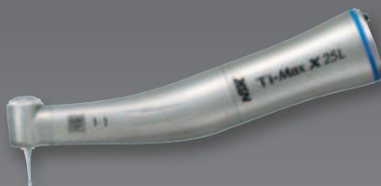
Winkelstück X25L mit Licht 1:1 Übertragung