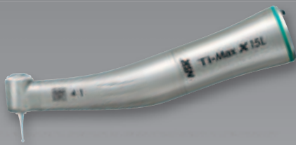
Winkelstück X15L mit Licht 4:1 Untersetzung