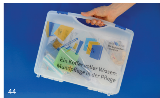
Die BLZK bietet mit dem Schulungskoffer „Pflege“ wertvolle Unterstützung.