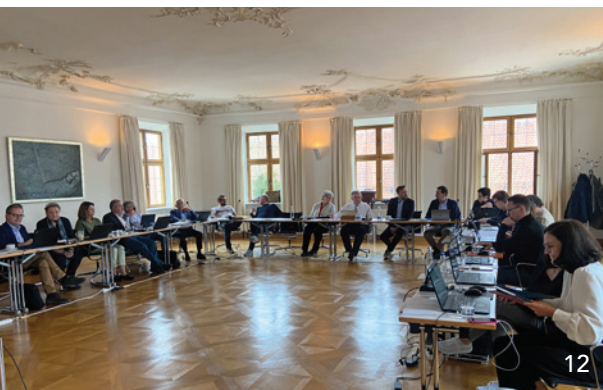
Der Vorstand der Bayerischen Landeszahnärztekammer traf sich im Kloster Seeon zu seiner Klausurtagung.