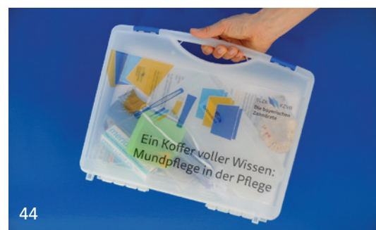
Die BLZK bietet mit dem Schulungskoffer „Pflege“ wertvolle Unterstützung.