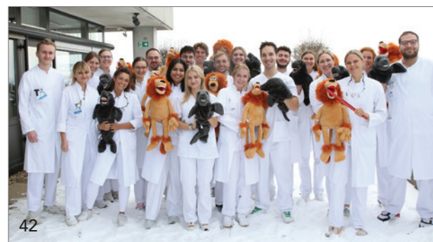
LAGZ-Handpuppen unterstützen Studierende der Zahnmedizin der Uni Regensburg bei der Behandlung kleiner Patienten.