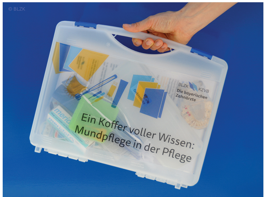
Der Schulkoffer „Ein Koffer voller Wissen: Mundpflege in der Pflege“ enthält alles, was man für die Schulung von Pflegenden braucht.