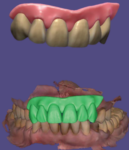
3D-Zahnaufstellung in Smile Creator.

umsetzen lässt. Daher nutze ich dieses Modul für die Planung aller implantatprothetischen Arbeiten von Einzelimplantaten im Frontzahnggebiet über Kombi-Zahnersatz bis zu All-on-4-/All-on-6-Versorgungen.