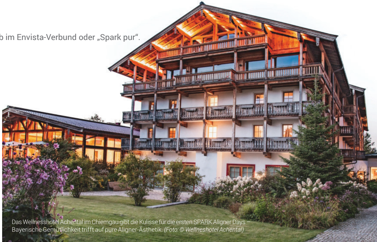
Das Wellnesshotel Achenal im Chiemgau gibt die Kulisse für die ersten SPARK Aligner Days – Bayerische Gemütlichkeit trifft auf pure Aligner-Ästhetik.