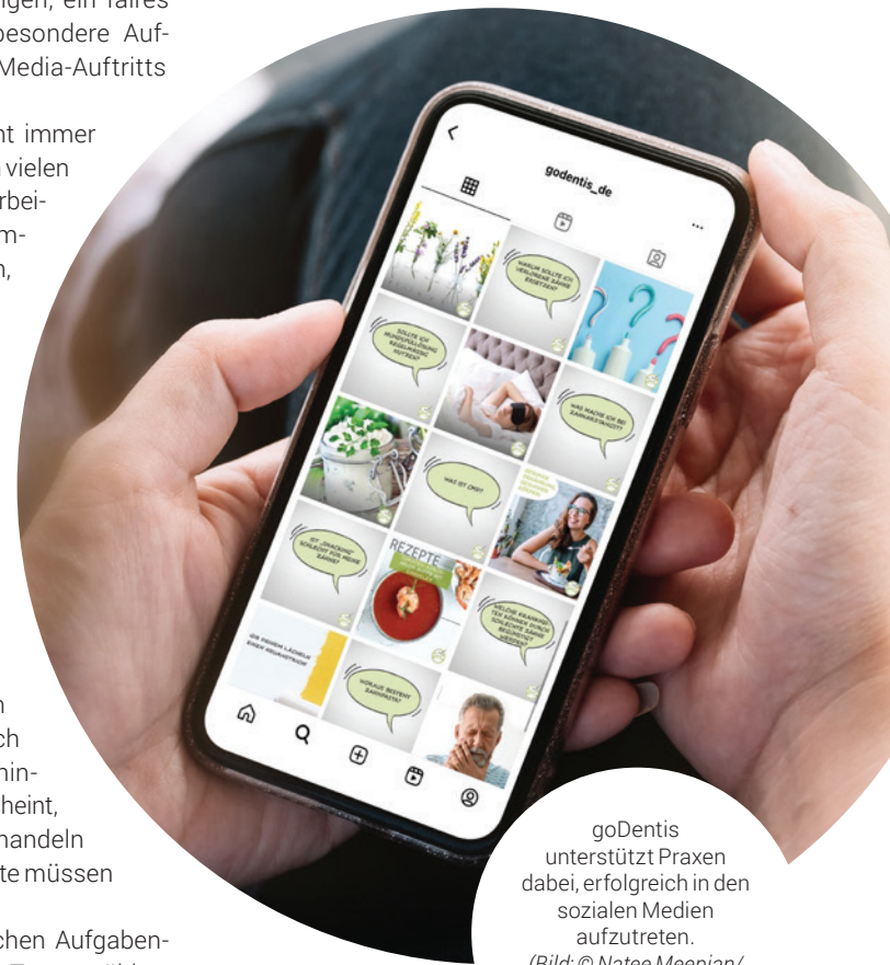
goDentis unterstützt Praxen dabei, erfolgreich in den sozialen Medien aufzutreten.

lands größtes Qualitätssystem für Zahnärzte und Kieferorthopäden, unterstützen dabei. Bilder, Vorlagen und Themenpläne können Partnerpraxen kostenfrei nutzen. Wer goDentis besser kennenlernen möchte, kann einen Blick auf www.godentis.de werfen und findet dort Infos, Ansprechpartner und weitere Vorteile einer Partnerschaft.