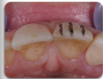
MDT - DDS Attilio Sommella