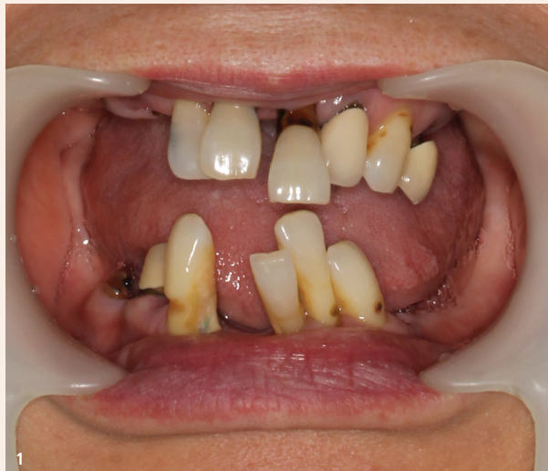
Abb. 1: Ausgangssituation. – Abb. 2: Ausgangslage nach Exzision aller Zähne. Die Exzisionswunden sind gut ausgeheilt, ein gesundes Mundmilieu ist wieder aufgebaut.

Eine 67 Jahre alte Patientin wurde in unserer Praxis vorstellig, da sie mit ihrer natürlichen Restbezaahnung unzufrieden war und an chronischer Parodontitis litt. Diese war bislang unbehandelt geblieben. Die schlechte Mundsituation beeinträchtigte die Lebensqualität der Patientin in hohem Maße: Sie hatte Schwierigkeiten beim Zerklei-