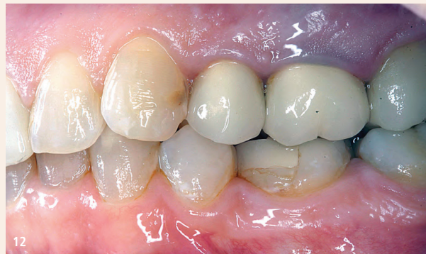
Abb. 10: Übersicht von Patient 3. – Abb. 11: Zahn 16 und 46 vor Behandlung mit Plasma Liquid Dental-Gel. – Abb. 12: Zahn 24 vor Behandlung mit Plasma Liquid Dental-Gel.

Zur Untersuchung wurden oberflächenverspiegelte plane Spiegel der Größe 5, eine zahnärztliche Sonde und eine WHO-Parodontalsonde (alle Henry Schein Dental) benutzt. Die Ausprägung der Gingivitis 6 wurde jeweils durch den Behandler evaluiert und eingestuft in: