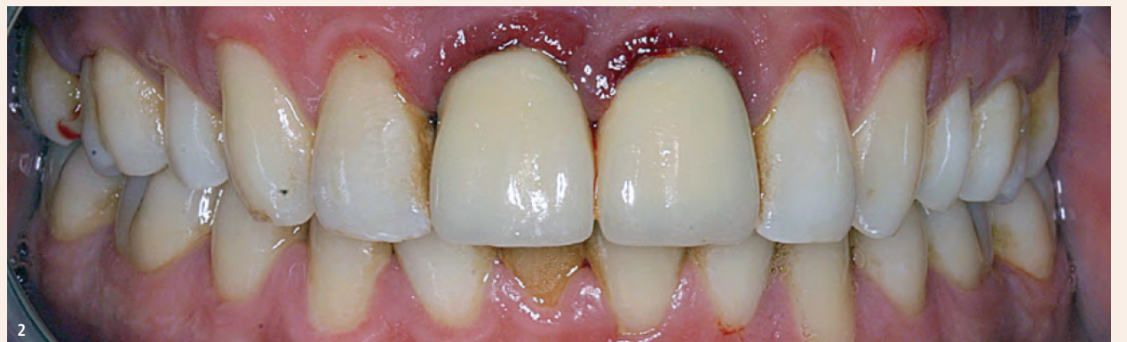
Abb. 1: Applikation des Plasma Liquid Dental-Gels subgingival mit einer stumpfen Kanüle an Zahn 25. – Abb. 2: Übersicht von Patient 1. – Abb. 3: Palatinal war die Gingivitis deutlich schwächer ausgeprägt.

im Rahmen der allgemeinen Anamnese abgefragt. An das Ausfüllen der Fragebögen schloss sich eine klinische Untersuchung an, in der die Mundhygiene anhand des modifizierten Approximalraum-Plaques-Index (mAPI), 7 des Papillen-Blutungs-Index (PBI) 8 sowie Messungen der Sondierungstiefen (ST) erhoben wurden. Bei Erhebung des mAPI werden die Zähne des 1. sowie des 3. Quadranten vestibulär und die Zähne des 2. sowie des 4. Quadranten oral auf Plaque untersucht und in folgende vier Scores unterteilt: