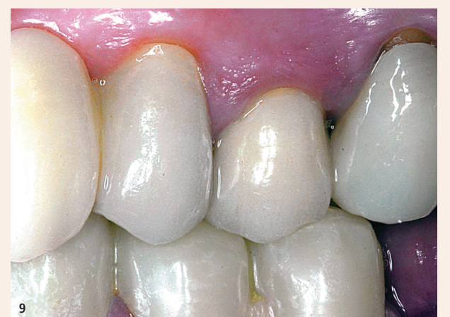
Abb. 4: Zähne 11 und 21 vor Behandlung mit Plasma Liquid Dental-Gel. – Abb. 5: Zähne 11 und 21 nach Behandlung mit Plasma Liquid Dental-Gel. – Abb. 6: Zähne 11 und 21 nach zwei Behandlungen mit Plasma Liquid Dental-Gel. – Abb. 7: Übersicht des Oberkiefers von Patient 2. – Abb. 8: Zahn 25 vor Behandlung mit Plasma Liquid Dental-Gel. – Abb. 9: Zahn 25 nach Behandlung mit Plasma Liquid Dental-Gel.