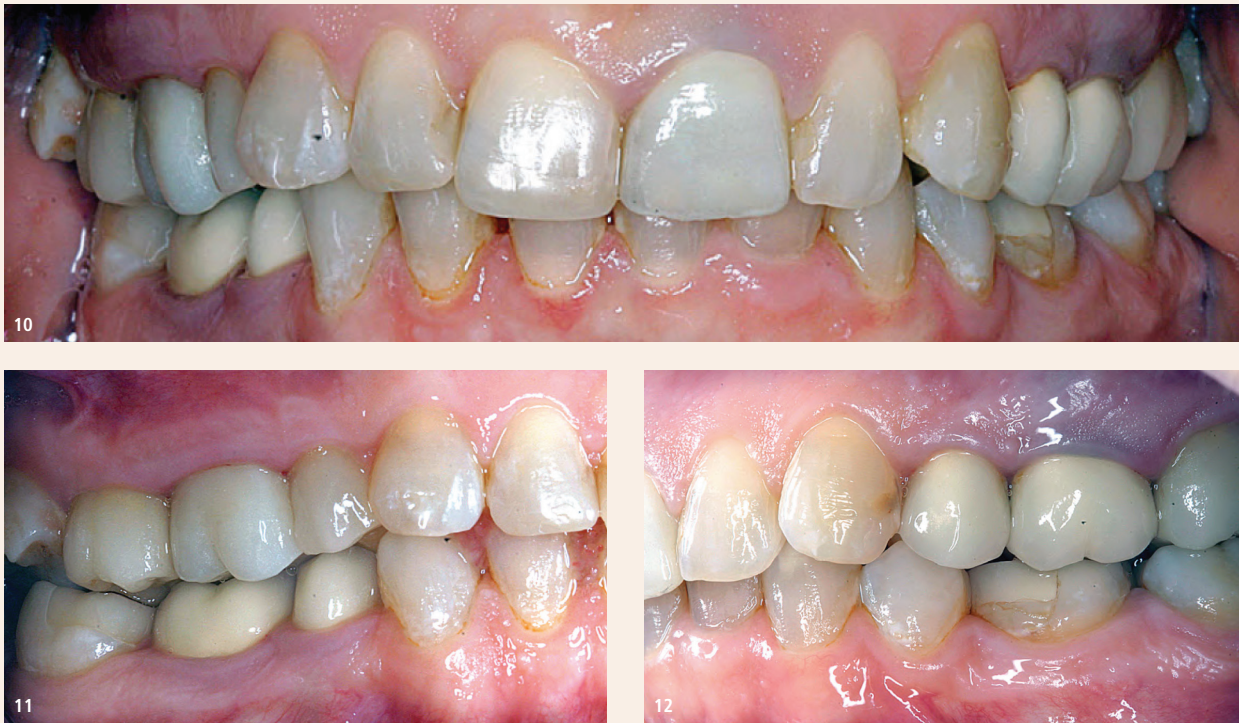
Abb. 10: Übersicht von Patient 3. – Abb. 11: Zahn 16 und 46 vor Behandlung mit Plasma Liquid Dental-Gel. – Abb. 12: Zahn 24 vor Behandlung mit Plasma Liquid Dental-Gel.

Zur Untersuchung wurden oberflächenverspiegelte plane Spiegel der Größe 5, eine zahnärztliche Sonde und eine WHO-Parodontalsonde (alle Henry Schein Dental) benutzt. Die Ausprägung der Gingivitis 6 wurde jeweils durch den Behandler evaluiert und eingestuft in: