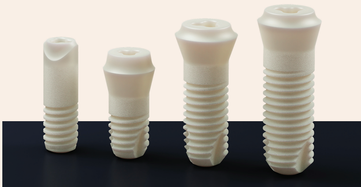
Abb. 3: Zweiteilige Patent™ Implantate mit verschiedenen Längen und Durchmessern.