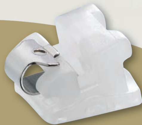
Quicklear®-Brackets 2. Generation

Mit dem Quicklear®-Bracket der 2. Generation konnte Forestadent die Keramikversion des etablierten Quick-Systems noch einmal verbessern. Dank einer neuen Oberflächenbehandlung schimmert der Metallclip nun matt anstatt zu glänzen und ist dadurch deutlich unauffälliger. Bracket- und Slotkanten wurden runder gestaltet und sorgen so für weniger Reibung und spürbar erhöhten Tragekomfort.