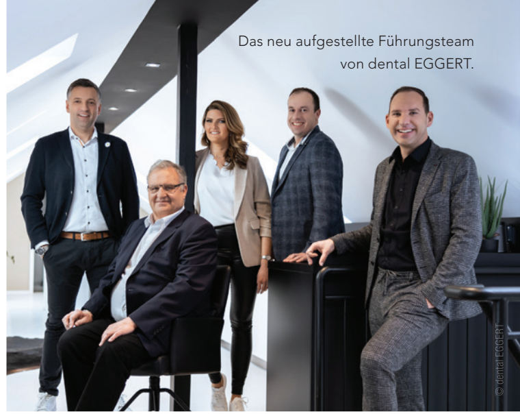
Das neu aufgestellte Führungsteam von dental EGGERT.