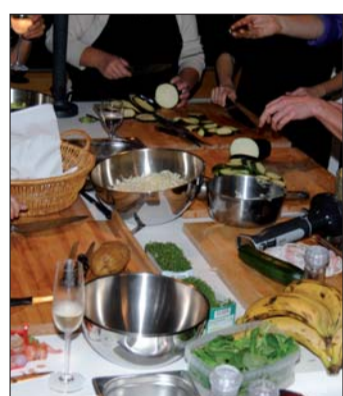
Beim Kochkurs hatten die Teilnehmerinnen alle Hände voll zu tun.

Ausgebucht mit Warteliste: Die Fortbildung „Exklusiv für Sie“ am 5. und 6. November in Köln war sehr gefragt und kam bei den 20 Teilnehmerinnen ebenso gut an. „Die Atmosphäre war angenehm, die Themen interessant und es machte Spaß, sich mit Kolle-