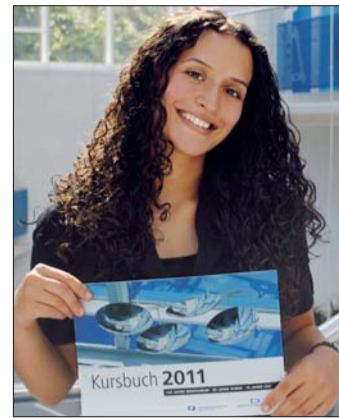
Das Kursbuch 2011 kann kostenlos angefordert werden.

Von anfangs gerade mal 10 verschiedenen Kursen in den Bereichen Kieferorthopädie und Zahntechnik, hat sich das Angebot inzwischen auf mehr als 100 verschiedene Kursthemen ausgeweitet. Die „Klassiker“ der 80er-Jahre, Modellgusskurse für Anfänger und Fortgeschrittene, KFO-Grundkurse und die Typodontkurse, wurden kontinuierlich ergänzt durch aktuelle Kurse zur Laser- und Teleskoptechnik, Spezialkurse in der kieferorthopädischen Zahntechnik, Keramikurse, Praxismanagement u.v.m. Einen sehr großen und wichtigen Anteil am Kursangebot der Dentaforum-Gruppe hat der Bereich Implantologie – hier finden erstklassige Fortbildungen, wie z.B. Humanpräparate-Kurse, statt. Auch 2011 bietet Dentaforum diese Kurse wieder an ver-