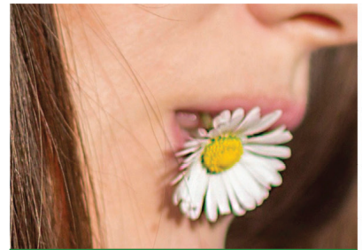
Die „Wirkung“ Mund-Wund-Pflaster