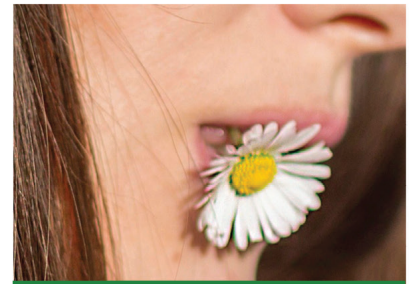
Die „Wirkung“ Mund-Wund-Pflaster