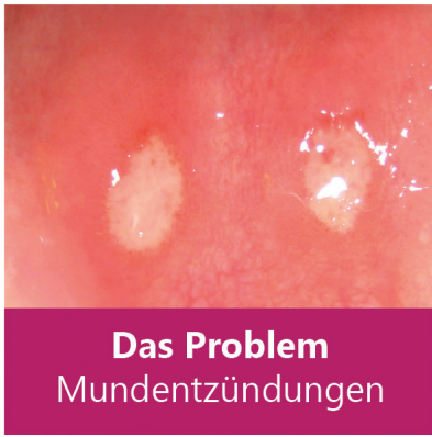
Das Problem Mundentzündungen