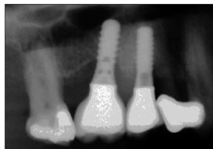
Abb. 2: Ausgangsbefund (OPG-Ausschnitt) mit schüsselförmigem Knochendefekt am Implantat 016.

Wegen der Tiefe des Knochendefekts bot sich eine Augmentation mit Knochenersatzmaterial an. Auf eine zusätzliche Membran wurde verzichtet, da wegen der konischen Implantatschultern kein speicheldichter Verschluss erzielt werden konnte. Auch konnte keine geschlossene Einheilung erfolgen, da beide Implantate weit über das Gingivaniveau herausragten. Wäre die Implantatgeometrie günstiger gewesen, wäre sicher eine geschlossene Defektdeckung mit zusätzlicher Membranstabilisierung vorzuziehen gewesen. Die aufgetretene Nahtdehiszenz und die am Ende beobachtete Gingivarezession wären durch ein solches Vorgehen wahrscheinlich weniger prominent aufgetreten. Trotz dieser leichten Einschränkung kann die oben beschriebene Behandlung dennoch als Erfolg gewertet werden, da nicht nur die Symptome der Periimplantitis beseitigt wurden, sondern es zusätzlich zu einer Neubildung von Knochen am Implantat gekommen ist. ☐