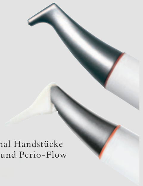
> Original Handstücke Air-Flow und Perio-Flow

Und wenn es um das klassische supra- gingivale Air-Polishing geht,