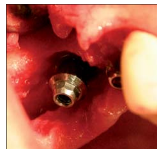
Abb. 5: Gereinigte Implantatoberfläche direkt nach dem Lasereinsatz.