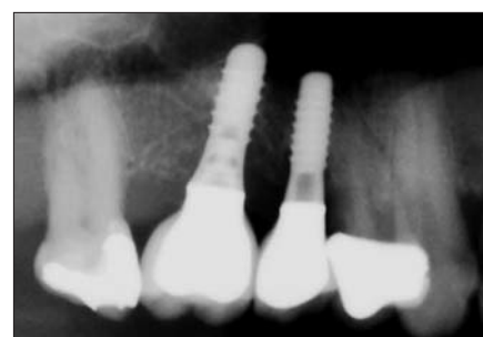
Abb. 9: Röntgenkontrolle nach sechs Monaten post OP mit knöchern regeneriertem Defekt.