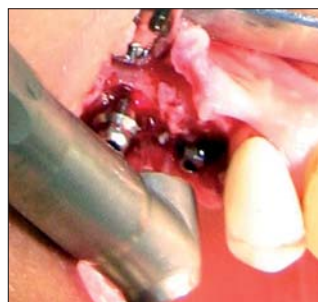
Abb. 4: Abtragung des Granulationsgewebes mit dem Er:YAG-Laser unter Wasser kühlung.