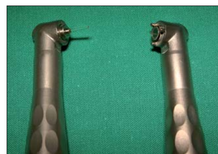
Abb. 10: Handstück R14 (links) und R02 (rechts) für den Fidelis Plus III-Laser.

Laser hin abzuzeichnen. Mehrere klinische Studien konnten bereits seine antibakterielle Wirksamkeit in Implantattaschen belegen (Schwarz et al. 2003, Schwarz et al. 2004, Schwarz et al. 2006). In vergleichbaren In-vitro-Studien wurde dieser bakterizide Effekt ebenfalls beobachtet (Kreisler et al. 2002a). Neben diesen positiven Eigenschaften des Er:YAG-Lasers konnten negative Effekte wie z.B. thermische Schäden durch Überhitzung nicht beobachtet werden (Kreisler et al. 2002b). Daneben traten auch keinerlei Veränderungen der Implantatoberflächen durch die Interaktion mit dem Laserlicht bei den eingesetzten Energieniveaus auf.