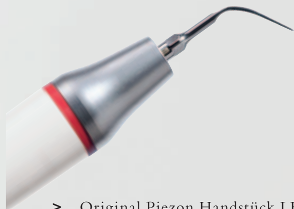
> Original Piezon Handstück LED mit EMS Swiss Instrument PS

Praktisch keine Schmerzen für den Patienten und maximale Schonung des oralen Epitheliums – grösster Patientenkomfort ist das überzeugende Plus der Original Methode Piezon, neuester Stand. Zudem punktet sie mit einzigartig glatten Zahnoberflächen. Alles zusammen ist das Ergebnis von linearen, parallel zum Zahn verlaufenden Schwingungen der Original EMS Swiss Instruments in harmonischer Abstimmung mit dem neuen Original Piezon Handstück LED.