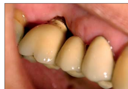
Abb. 8: Zustand der Gewebe sechs Monate post OP.