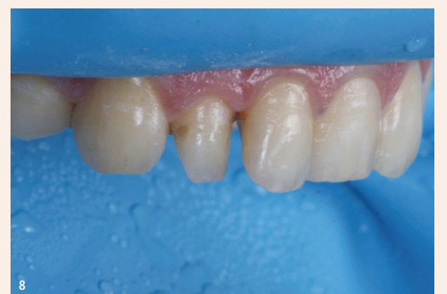
Abb. 6: Mithilfe eines individuellen Farbschlüssels aus dem Professional CompoSite System von White Dental Beauty wurde die beste Kombination aus Dentin- und Schmelzfarbe ausgewählt. Ein individueller Farbschlüssel ermöglicht die genaue Bestimmung der Zahnfarbe für eine optimale Ästhetik und zuverlässige Ergebnisse. – Abb. 7: Die Isolierung mit einem Kofferdam ist zwingend erforderlich, um eine saubere und trockene Umgebung zu gewährleisten. – Abb. 8: Nach einer kleinen runden Präparation des überschüssigen Inzisivs und Zahns 11 bukkal und 12 mesial war der proximale Bereich offen und bereit für den Einsatz der Matrize für die Rekonturierung.