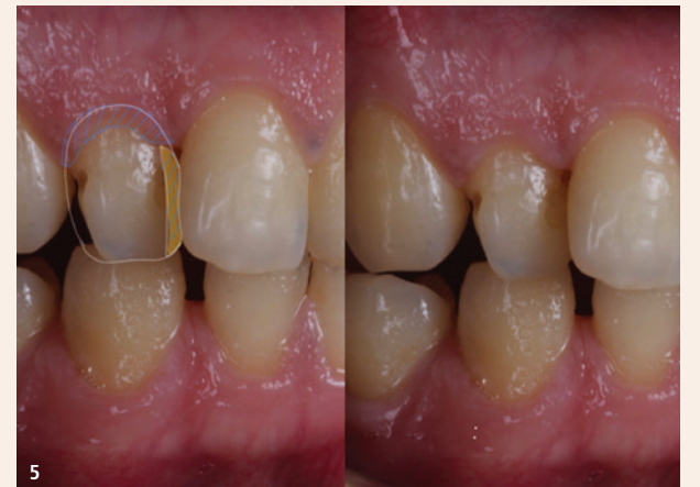
Abb. 3: Wir haben uns für Komposit-Veneers von 13 bis 23 entschieden, um Form und Ausrichtung zu korrigieren und die Zahnfarbe zu verbessern. Da dies in einer einzigen Sitzung erfolgen soll, haben wir beschlossen, dank der Unica-Matrize auf das Mock-up und das Wax-up zu verzichten. Wir hatten zwei Möglichkeiten: 1. Zahn 12 wird als dritter zentraler Schneidezahn inzisal auf die gleiche Höhe wie 11 und 21 gebracht. Der überschüssige Zahn wird als lateraler Inzisiv gestaltet (mit gerader Inzisalkante) und um 1 mm inzisal vom Niveau des Zahns 11 gekürzt. 2. Beide lateralen Inzisivi werden so beibehalten und Zahn 12 wird um 1 mm gekürzt (mit gerader Inzisalkante). Der überschüssige Zahn wird inzisal auf der gleichen Höhe wie Zahn 11 gekürzt, aber mit einer runden Schneidekante, um einen Übergang zum Eckzahn zu schaffen. Bevor wir entschieden, welche Option geeigneter wäre, beschlossen wir, mit der ersten Möglichkeit zu beginnen. – Abb. 4: Um die Ausrichtung zu korrigieren und gleichmäßige Abstände für das Kompositmaterial zu schaffen, ist zunächst eine kleine Präparation im distalen Bereich Regio 12 notwendig. – Abb. 5: Ohne Präparation wäre die Matrize zerdrückt, was zu einer Verformung und einer unpassenden, unhygienischen Kontur des Veneers führen würde. Die Präparation des markierten Bereichs öffnet den Zwischenraum und schafft eine neue Form für beide Seitenzähne. Auch war für den überschüssigen Zahn eine Gingivektomie erforderlich, um ein gutes Verhältnis zwischen Breite und Länge zu erreichen.