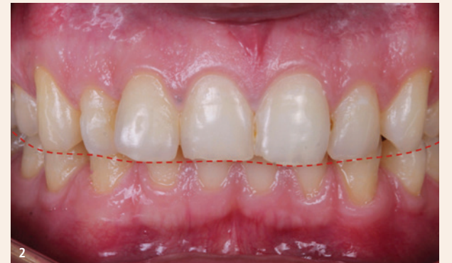
Abb. 1: Ein 32-jähriger Mann kam mit dem Wunsch nach einer besseren Zahnästhetik in unsere Zahnklinik. Er war mit der Form und der Ausrichtung seiner Zähne unzufrieden und wollte selbstbewusster lächeln. – Abb. 2: Die Frontalansicht zeigt eine abweichende Lachlinie, da die Inzisalkanten abgeplatzt sind und ungleichmäßig verlaufen. Distal liegt eine Approximalkaries vor. Die größte Herausforderung stellen jedoch die beiden rechten seitlichen Schneidezähne dar, von denen einer prokliniert und der andere rotiert und leicht retrokliniert ist. Nachdem wir den Behandlungsplan mit dem Patienten besprochen hatten, beschlossen wir, direkte Komposit-Veneers zu verwenden, um die Form und Ausrichtung der Zähne zu korrigieren. Eine kieferorthopädische Behandlung lehnte der Patient aufgrund der begrenzten Zeit und des Budgets ab.