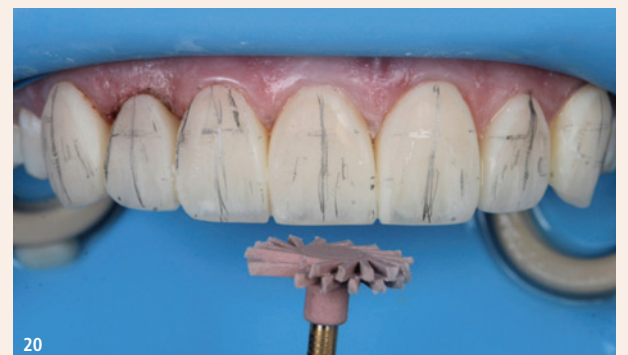
Abb. 18: Zunächst zeichneten wir mit einem dünnen Bleistift die Übergangs- und Lichtlinien ein. Wir verwendeten eine Scheibe, die sich dank ihrer Flexibilität an die Approximalfäche anpassen lässt. Wir bewegten uns von der Innenseite des interproximalen Bereichs wiederholt nach außen, bis wir symmetrische Breiten hatten. – Abb. 19: Wir verwendeten den Diamant-Perio-Bohrer mit niedriger Geschwindigkeit, um eine sekundäre Anatomie zu schaffen, die inzisal breiter und zervikal schmaler ist. Wir setzten den Körper des Bohrers inzisal und neigten die Spitze leicht nach zervikal, um den schmalen Teil zu gestalten. – Abb. 20: Hier verwendeten wir eine Gummischeibe, die sich leicht an alle Oberflächen-details anpassen kann. Eine Neigung von 45° von zervikal nach inzisal mit intermittierenden Berührungen ist ideal, um alle Oberflächenunregelmäßigkeiten und scharfen Stellen zu entfernen (ohne jedoch die Oberflächentextur zu ändern), wodurch die Restaurationen sehr glatt werden. Der aktive Teil des Gummis ist die Endseite, nicht der ganze Körper.