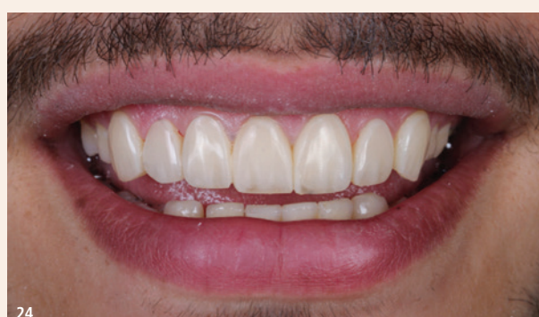
Abb. 21: Der Lucida™ Star und die DiaShine Lucida™ Paste (beide Styleitaliano) ermöglichen eine einstufige Politur von Kompositrestaurationen, die innerhalb von Sekunden auf Hochglanz gebracht werden. – Abb. 22: Situation unmittelbar nach dem Polieren mit hochglänzender Oberfläche. Das Ergebnis war noch nicht zufriedenstellend, also beschlossen wir, eine kleine Korrektur vorzunehmen: Zahn 11 wurde inzisal um 1 mm gekürzt und der überschüssige Zahn wurde etwas abgerundet, um die inzisale Lücke etwas mehr zu öffnen und somit eine Ähnlichkeit mit dem Eckzahn zu schaffen. – Abb. 23: Die Seitenansicht zeigt die neue Ausrichtung, die Formänderung und die natürlichen Inzisalkanten im 1. Quadranten. – Abb. 24: Finales Ergebnis.