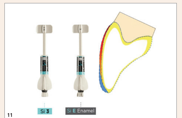
Abb. 9: Wie bei allen restaurativen Eingriffen an der Schmelzoberfläche wurde die gesamte labiale und inzisale Zahnoberfläche 30 Sekunden lang geätzt. – Abb. 10: Ein Universaladhäsiv wurde durch aktives Einreiben auf die Oberfläche aufgetragen und mit dem Curing Pen von Eighteenth 20 Sekunden lang lichtgehärtet. – Abb. 11: Für die Restaurationen wurden eine dentinähnliche Farbe für die labiale Oberfläche und eine schmelzähnliche Farbe für das inzisale Drittel verwendet. In Fällen, in denen ein jüngerer Patient etwas mehr Helligkeit benötigt, ist die Si E-Farbe (Schmelz) die perfekte Option, da sie die Farbe des Trägermaterials für ein natürliches Aussehen aufnimmt. Außerdem vermeiden wir auf diese Weise die Probleme, wie den Glaseffekt, die mit einer zu starken Schmelzfarbe verbunden sind.