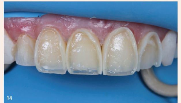
Abb. 12: In Abwesenheit eines Silikonindex wurde die palatale Oberfläche mit Mylar-Strips aufgebaut. – Abb. 13: Ein gutes Matrizensystem trägt dazu bei, die natürliche Form des Zahns mit optimalen ästhetischen Ergebnissen nachzubilden. Hier haben wir die Unica-Matrize für die beiden zentralen Inzisivi verwendet, um eine symmetrische Form und Kontur zu erhalten. Eine gute Umrisslinie dieser beiden Zähne erleichtert das Übertragen der Umrisse auf die Seiten- und Eckzähne. Dies ist sehr wichtig, da der Augenfokus immer auf der Mittellinie liegt. – Abb. 14: Nach dem Aufbau der approximalen Wände und der Herstellung eines Unica-Rahmens mit Si3-Dentinfarbe ist die Symmetrie zu beachten, die durch eine gute Auswahl der Matrizen erreicht wurde.