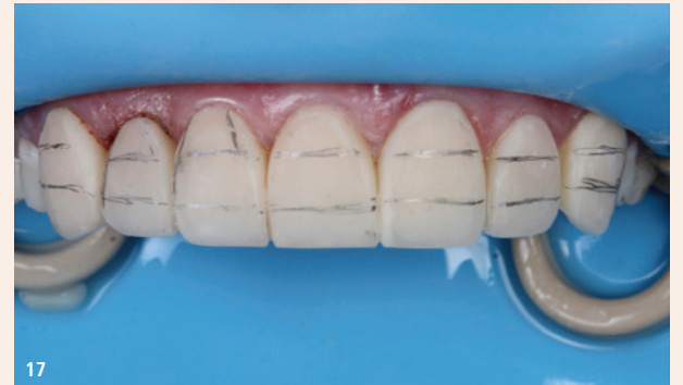
Abb. 15: Die Unica Minideep-Matrize ist perfekt für den zweiten Schneidezahn. Beachten Sie die Anpassungsfähigkeit an die gewünschte Form. – Abb. 16: Nach der Schichtung von Dentinfarben und der Herstellung von Mamelons wird ein kleiner Raum für die Schmelzschicht und die inzisale Ausarbeitung gelassen. – Abb. 17: Korrektur der Zahnneigungen und -konturen unter Berücksichtigung der labialen Krümmung der Zähne und der mesiodistalen Neigungswinkel.