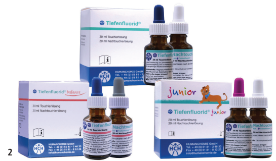
Abb. 1: Behandlungsphasen. – Abb. 2: Tiefenfluorid.

White Spots sollten von den Patienten stets plaquefrei gehalten werden. In der ersten Woche führen wir die Behandlung dreimal durch. Die Kontrolle mit Touchierung erfolgt alle zwei bis drei Monate oder wird mindestens zwei- bis dreimal pro Jahr wiederholt.