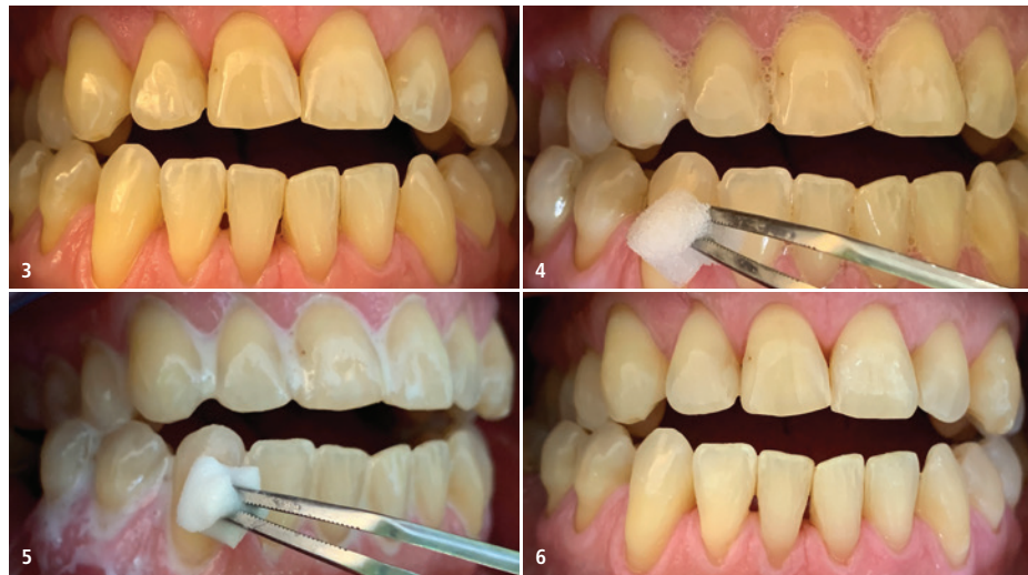
Abb. 3: Ausgangssituation. – Abb. 4: Aufbringen der Touchierlösung. – Abb. 5: Aufbringen der Nachtouchierlösung. – Abb. 6: Situation nach der Behandlung.

Anita Fisch Zahnarzt- & Prophylaxepraxis Olaf Riedel Pater-Viktrizius-Weiß-Straße 5 84307 Eggenfelden Deutschland Tel.: +49 8721 10445 info@zahnarzt-eggenfelden.de