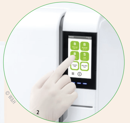
Abb. 1: Lisa überzeugt jeden Tag aufs Neue durch hohe Leistungsfähigkeit, Anwenderfreundlichkeit sowie durch die EliSense LED-Anzeigen. – Abb. 2: Auch ihr Äusseres überzeugt durch ein ergonomisches, platzsparendes Design und eine elegante pflegeleichte Linienführung.