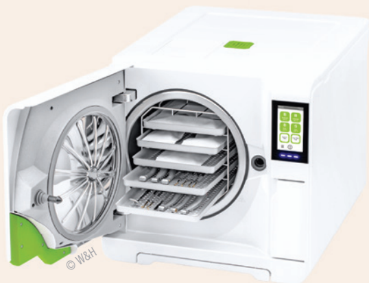
Abb. 3: Der neue hochwertige Lisa-Sterilisator – unerwartete Anwendererfahrung und Top-Leistung.