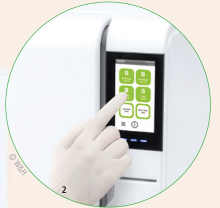
Abb. 1: Lisa überzeugt jeden Tag aufs Neue durch hohe Leistungsfähigkeit, Anwenderfreundlichkeit sowie durch die EliSense LED-Anzeigen. – Abb. 2: Auch ihr Äusseres überzeugt durch ein ergonomisches, platzsparendes Design und eine elegante pflegeleichte Linienführung.