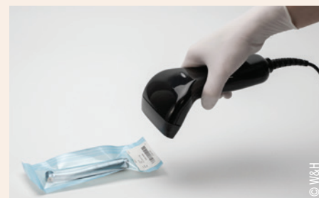
Abb. 4: EliTrace – neues Rückverfolgbarkeitssystem zur Nachverfolgung des Sterilisationsstatus von jedem einzelnen Instrument oder Set.

Mit dem neuen Miet-Service bietet W&H CH-AG eine einfache und kostengünstige Lösung für Kunden, die einen zuverlässigen Sterilisator benötigen. Interessierte können sich jederzeit an das Unternehmen wenden, um ein individuelles Angebot zu erhalten. DT