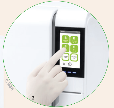
Abb. 1: Lisa überzeugt jeden Tag aufs Neue durch hohe Leistungsfähigkeit, Anwenderfreundlichkeit sowie durch die EliSense LED-Anzeigen. – Abb. 2: Auch ihr Äusseres überzeugt durch ein ergonomisches, platzsparendes Design und eine elegante pflegeleichte Linienführung.