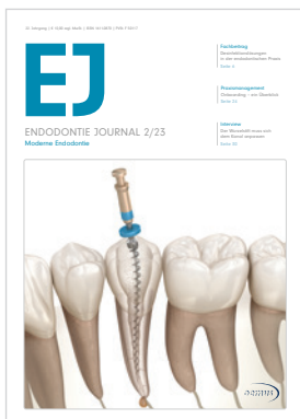
Titelbild: © Alex Mit/Shutterstock.com