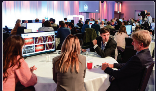
Abb. 1 und 2: Impressionen Table Clinics.

Neben dem rein wissenschaftlichen Programm finden auch wieder die beliebten Table Clinics statt. Rund 25 Tische in drei Staffeln stellen die Programmierer für Hamburg wieder zur Verfügung. Fortbildung mit wissenschaftlichem, praktischem und praxisrelevantem Anspruch ist das klar festgelegte Ziel der Organisatoren. Als Highlight wird in 2023 der DGZI „Implant Dentistry Award“ in gleich drei Kategorien vergeben. Auf der Bühne zur Verleihung stehen dann erstmalig, neben implantologisch tätigen Zahnärzten, Vertreter des gesamten Praxisteams und erhalten ihre Auszeichnung in den Kategorien „Zahnärztliche Implantologie“, „Implantologische Assistenz“ und „Zahntechnische Implantatprothetik“. Die Poster können vor, während und auch nach dem Kongress digital abgerufen werden. Die Siegerposter werden am ersten Kongresstag im Mainpodium vorgestellt und prämiert.